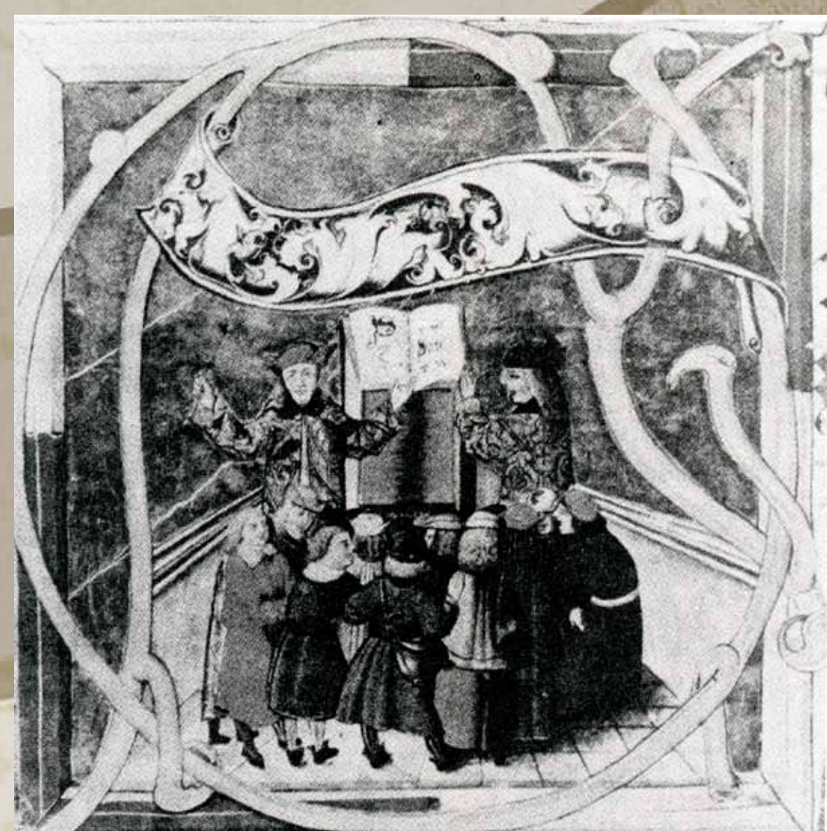
Chór zaków i kantorzy, Graduał Jana Olbrachta, około 1505, Waclaw Panek, Gaude, Mater Polonia , Warszawa 1990, s. 38