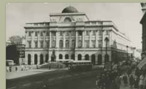
Pałac Staszica, 1963, KLZ