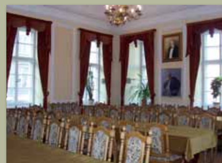
Sala im. Stanisława Staszica