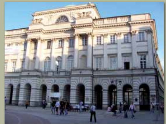
Pałac Staszica, 2008