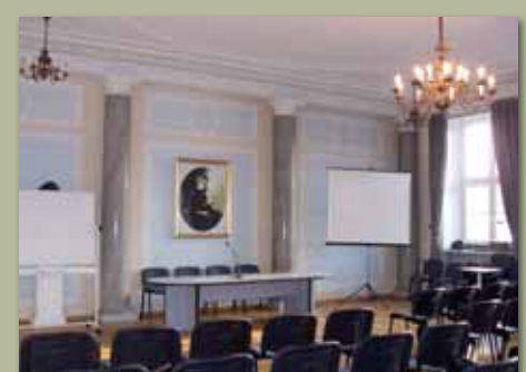
Sala im. Marii Skłodowskiej-Curie

Reprezentacyjne sale Pałacu Staszica, 2009, fot. J. Arvaniti, T. Rudzki, B. Wiktorowska