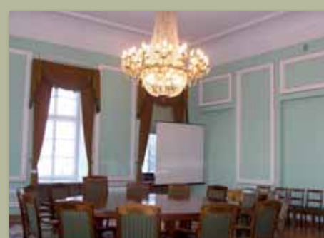
Sala Okrągłego Stołu