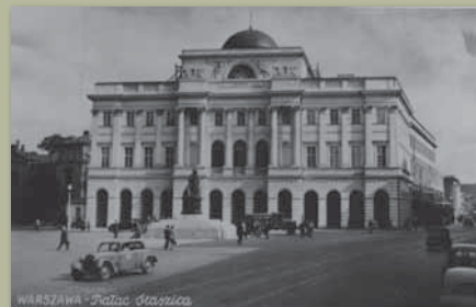
Pałac Staszica, 1956, KLZ