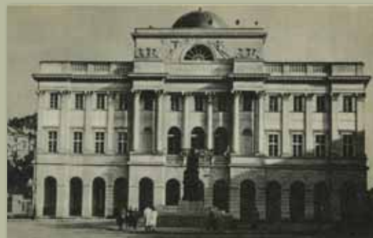
Pałac Staszica, lata 50., KLZ