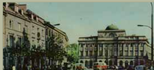
Pałac Staszica, lata 60., KLZ