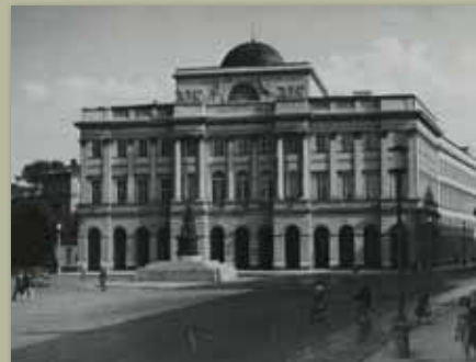
Pałac Staszica, 1959, KLZ