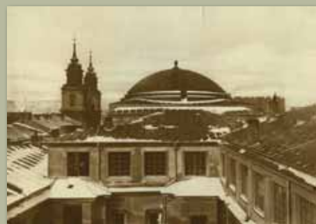
Widok z lotu ptaka na kopułę Pałacu Staszica, b.d., APAN, Zbiór Fotografii, XVI-37