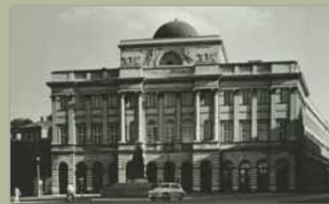
Pałac Staszica, 1961, KLZ