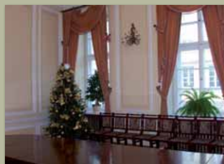
Sala im. Hugona Kołłątaja