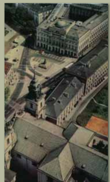
Krakowskie Przedmieście, widok z lotu ptaka na Pałac Staszica, 1970, KLZ