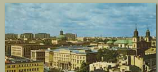
Widok z lotu ptaka na Pałac Staszica, 1973, KLZ