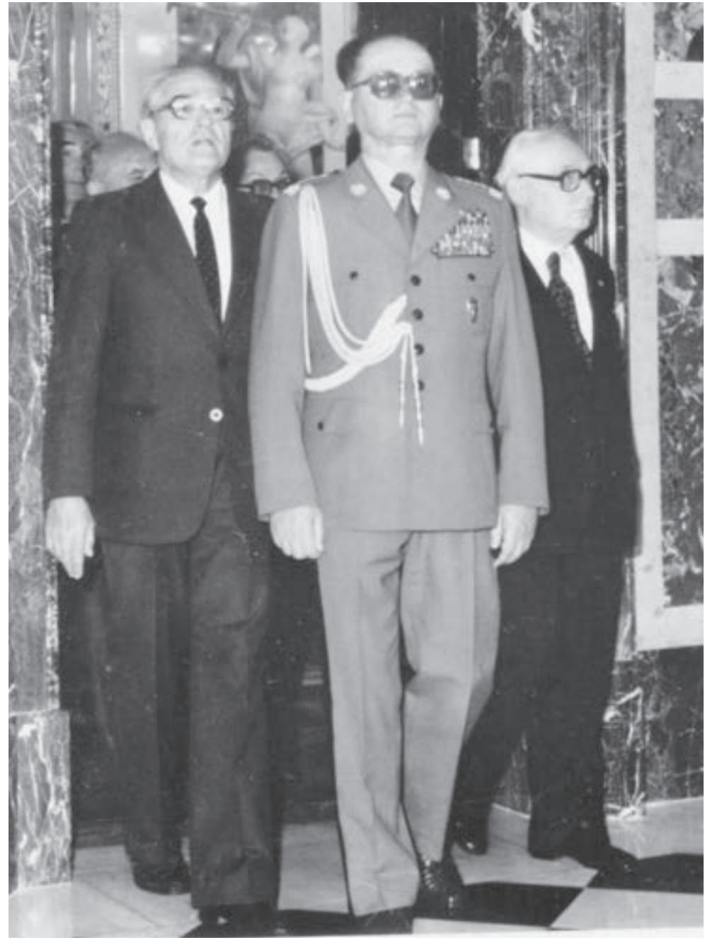
Generał Wojciech Jaruzelski, profesor Aleksander Gieysztor, 1. sekretarz KCPZPR Edward Gierek podczas uroczystości otwarcia Zamku Królewskiego w Warszawie, 31 sierpnia 1984