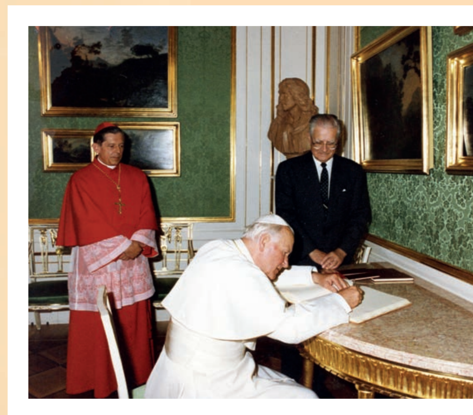
Papież Jan Paweł II, kardynał Józef Glemp, profesor Aleksander Gieysztor na Zamku Królewskim w Warszawie, 1991