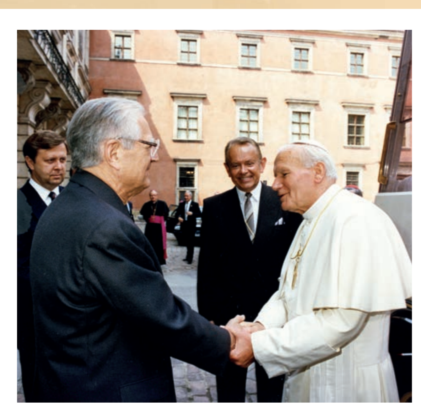
Papież Jan Paweł II, profesor Aleksander Gieysztor — powitanie na dziedzińcu Zamku Królewskiego w Warszawie, 1991

„Pamiętam dobrze ten dzień, w którym profesor Gieysztor zaprosił mnie, żeby pokazać puste jeszcze wnętrza Zamku. Było to kilka tygodni od przejścia przez niego funkcji dyrektora Zamku Królewskiego w Warszawie. Na parterze dopiero urządzono profesorowi skromny gabinet. Ale główne wnętrza Zamku były puste i byłem oszołomiony, kiedy profesor Gieysztor, zatrzymując się to tu, to tam, gdy ja widziałem tylko gołe ściany i podłogi, biorąc mnie delikatnie za ramię, kierował w jakieś miejsce pusty sypialni króla, kiedyś sali Rady, i opowiadał o tronie, baldachimie, stole, fotelach, obrazach, lichtarzach, lustrach, które to przedmioty istniały realnie w jego umyśle, zakodowane już dawno jako fragmenty scenariusza urządzeń każdej sali, każdej komnaty. Opowiadał też o kolejnych etapach urządzania wnętrza. Jako jedna z pierwszych, nadających się do urządzenia spotkań, była gotowa sala Senatorska, gdzie w maju 1981 roku odbyły się uroczystości ku czci uchwalenia Konstytucji 3 maja.”