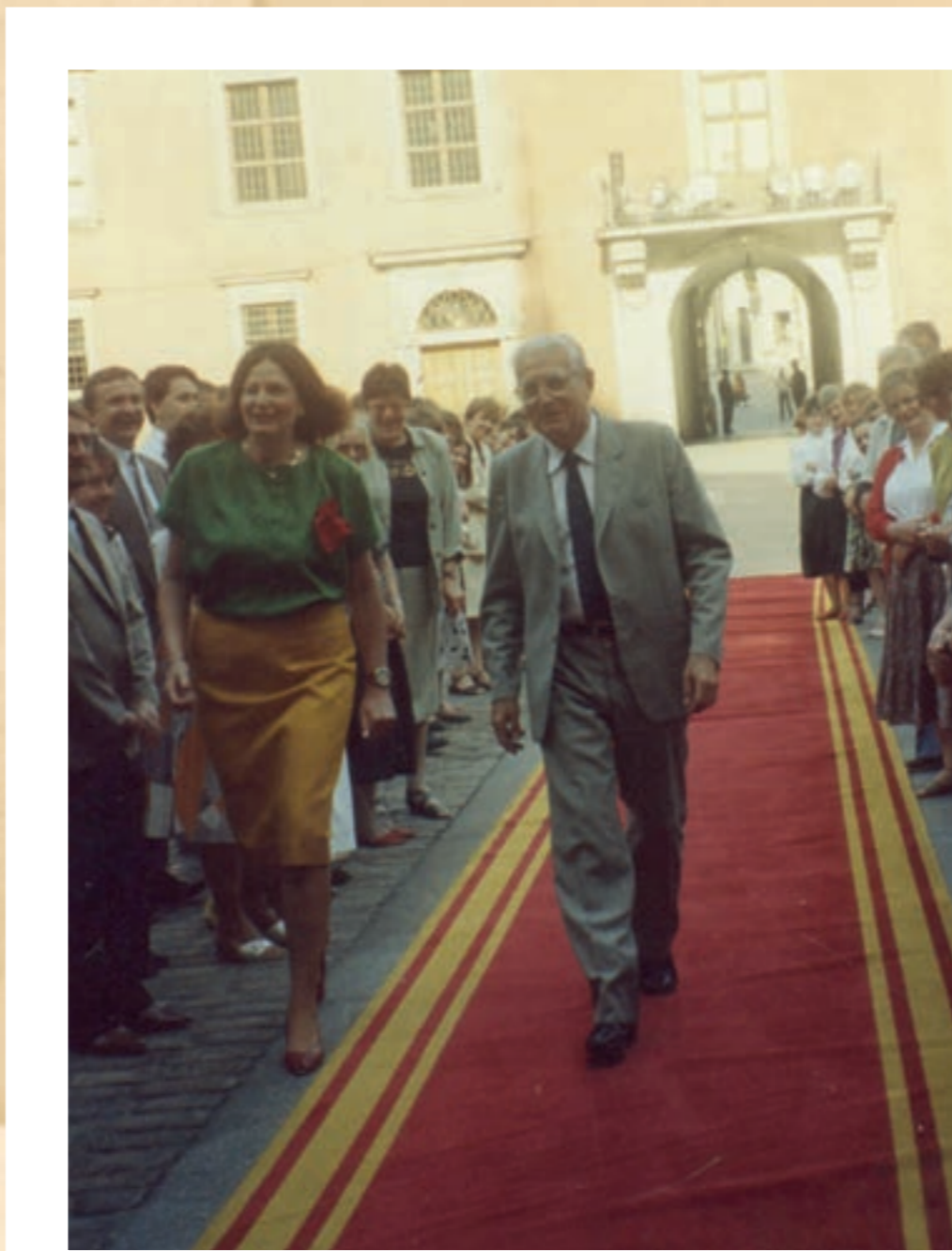
Aleksander Gieysztor podczas uroczystości na Zamku Królewskim w Warszawie, 1991