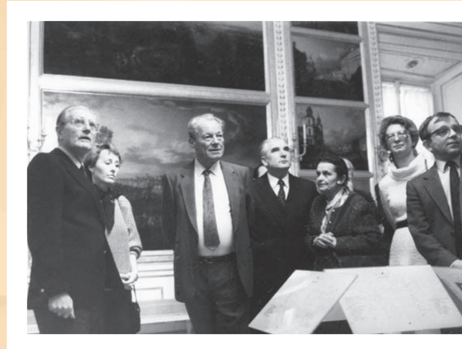
Kancelarz Republiki Federalnej Niemiec Willy Brandt (2. od lewej) na Zamku Królewskim w Warszawie, 1990