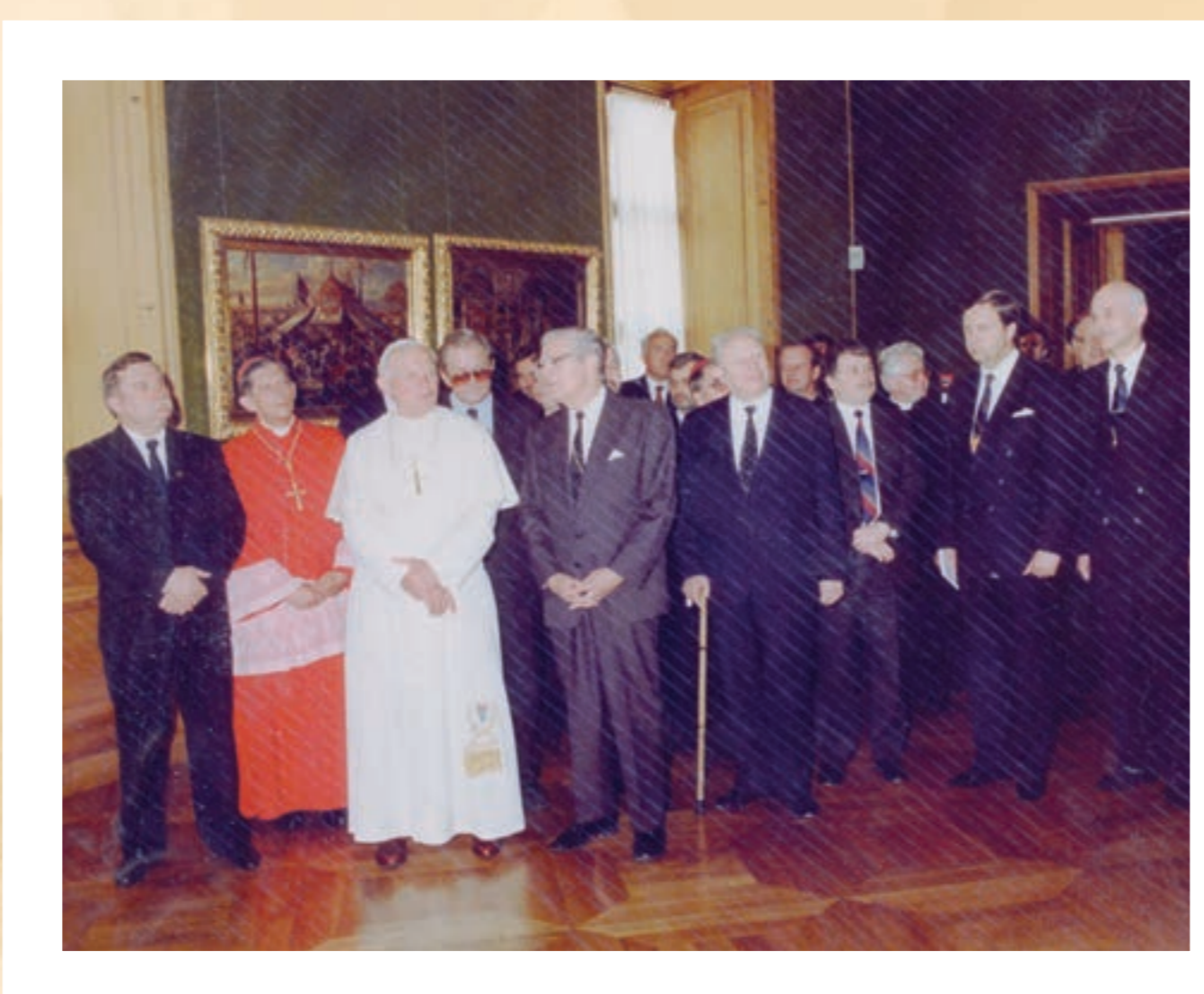
Prezydent Lech Wałęsa, papież Jan Paweł II, profesor Aleksander Gieysztor na Zamku Królewskim w Warszawie, z tytu m.in. kardynał Józef Glemp, profesor Andrzej Stelmachowski, przyszedł prezydent RP Lech Kaczyński, 1991