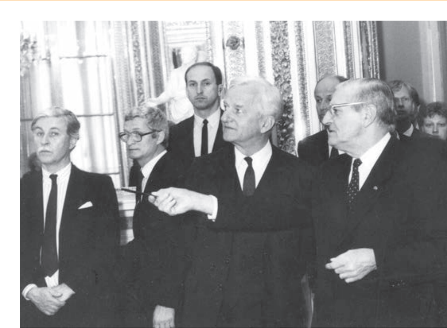
Prezydent Republiki Federalnej Niemiec Richard von Weizsäcker (3. od lewej) na Zamku Królewskim w Warszawie, 1990