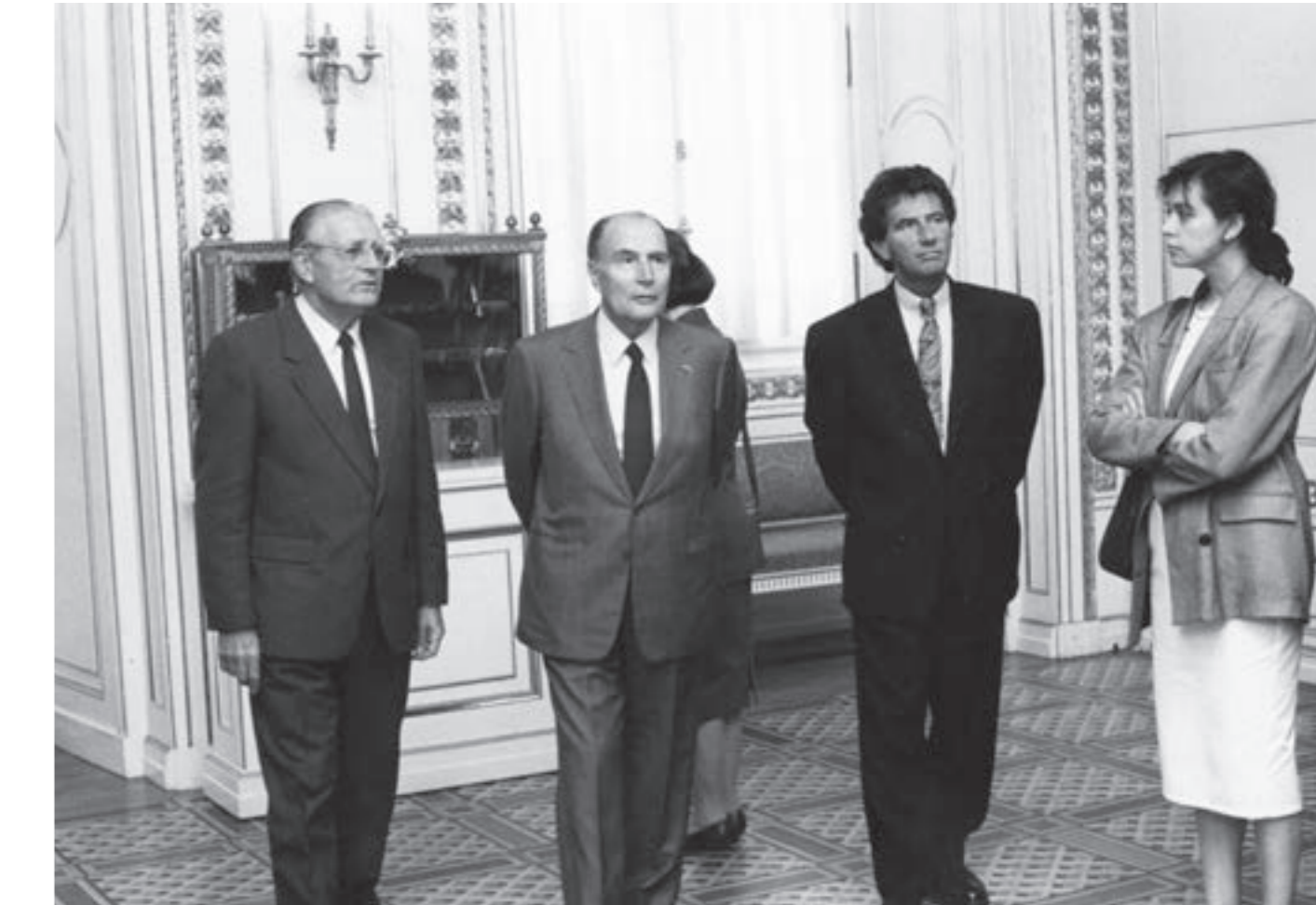
Profesor Aleksander Gieysztor oprowadza prezydenta Francji François Mitteranda (2. od lewej) po Zamku Królewskim w Warszawie, 15 czerwca 1989

Uroczystość otwarcia Zamku Królewskiego w Warszawie, 31 sierpnia 1984, Gdy ktoś z historyków zapytał Aleksandra Gieysztor, dlaczego tyle myśli i energii związał z Zamkiem Królewskim w Warszawie, powiedział spontanicznie: „Bo tu działa się nasza historia”.