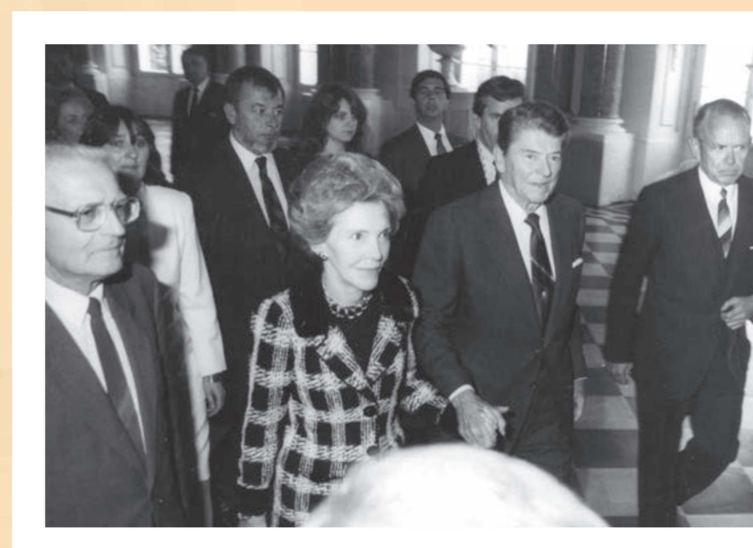
Wizyta prezydenta USA Ronalda Reagana (3. od lewej) na Zamku Królewskim w Warszawie, 14 września 1990