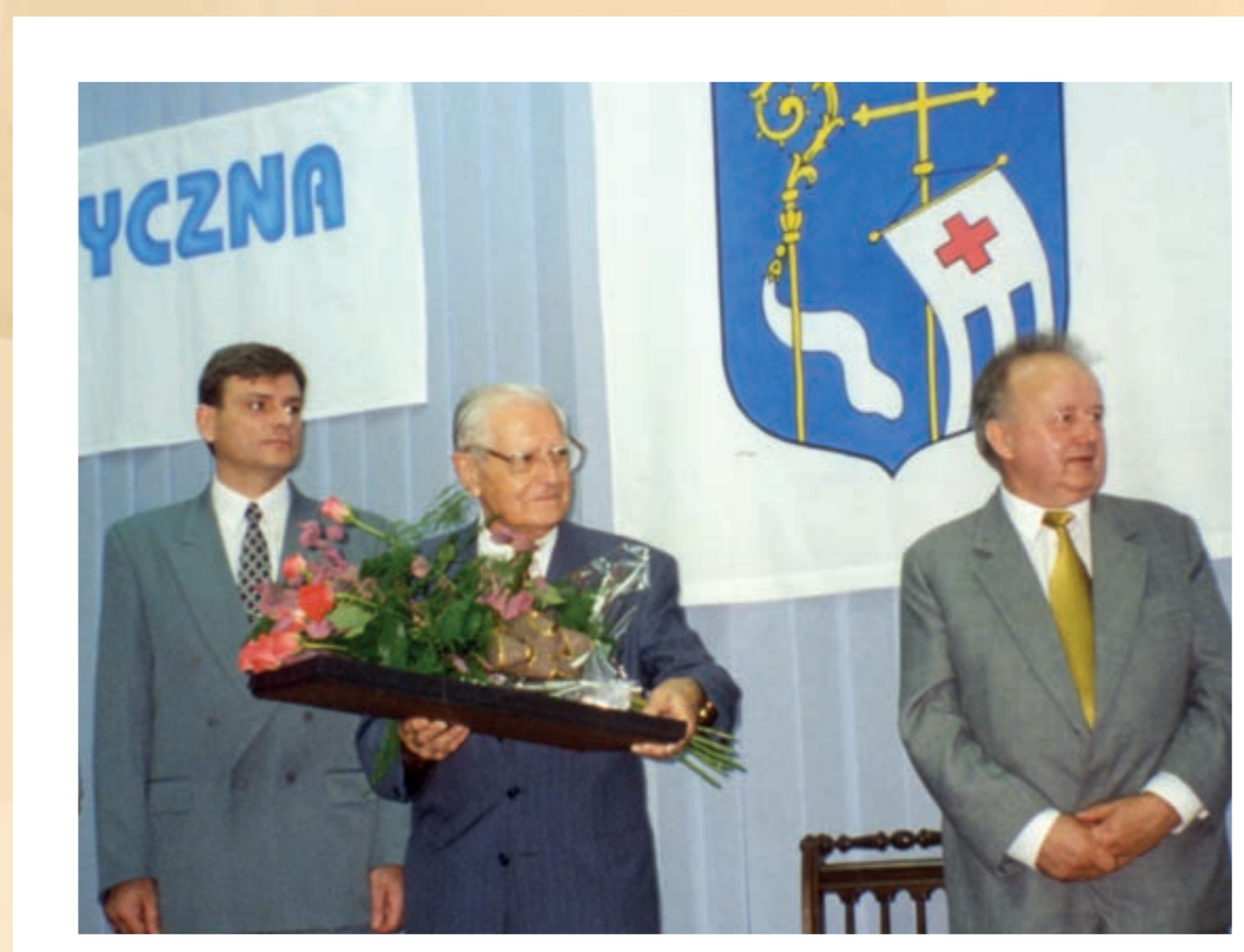
Uroczystość mianowania Aleksandra Gieysztora Honorowym Obywatelom Miasta Pułtuska, 1998