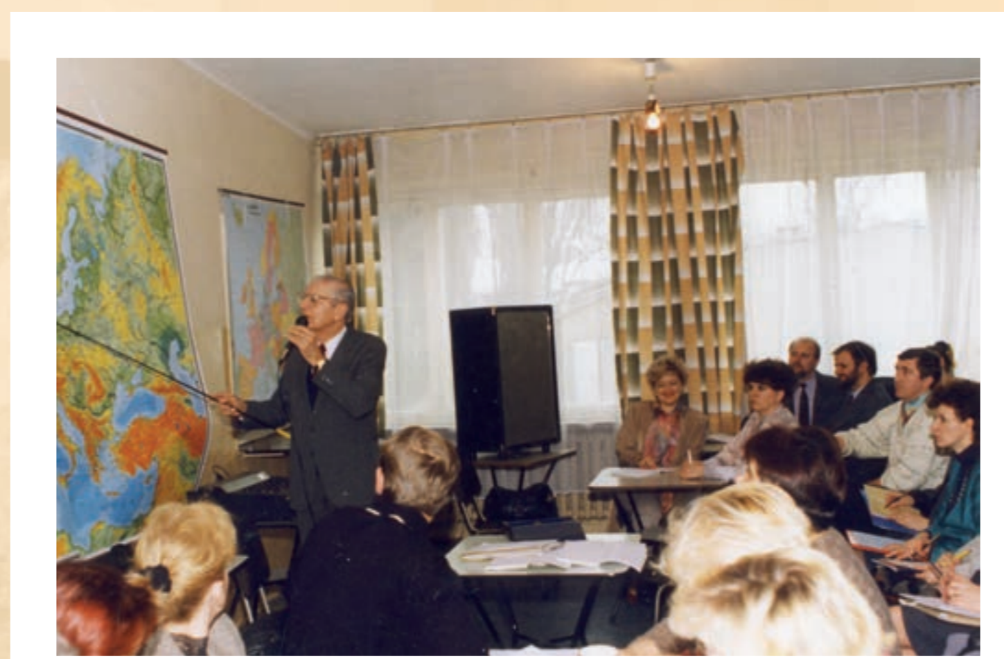
Profesor Aleksander Gieysztor wygłasza wykład z historii cywilizacji dla studentów Wyższej Szkoły Humanistycznej w Pułtusku, b.d., Wykłady profesora Aleksandra Gieysztora cieszyły się ogromną popularnością wśród studentów WSH.