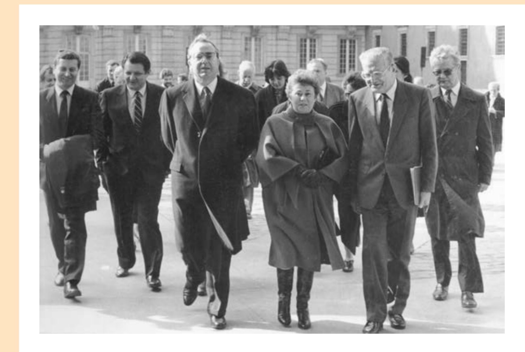
Wizyta premiera Królestwa Belgii Wilfrieda Martensa (1. od lewej) na Zamku Królewskim w Warszawie, 30 marca 1989.