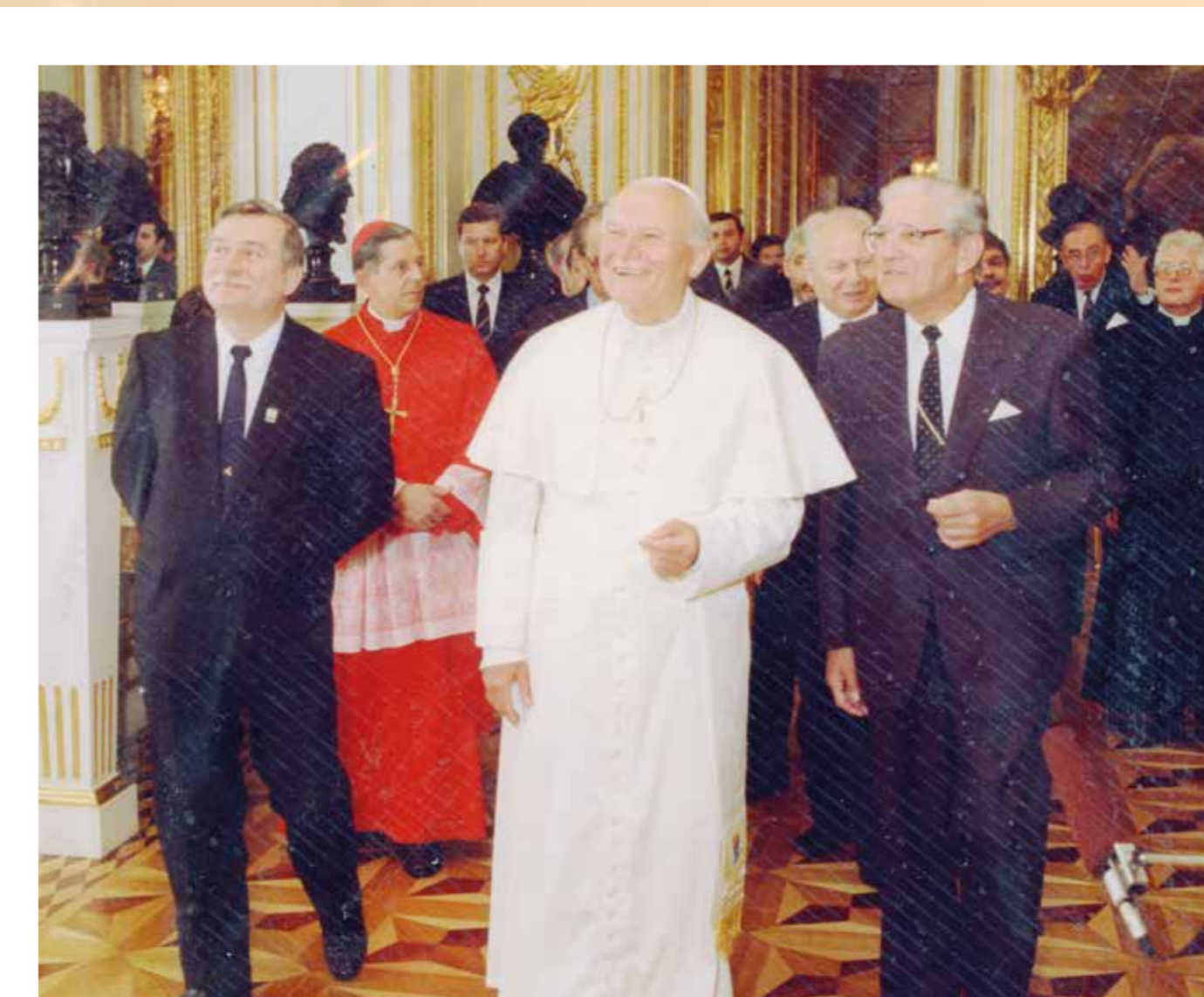
Wizyta papieża Jana Pawła II, prezydenta Rzeczypospolitej Polskiej Lecha Wałęsy, kardynała Józefa Glempa (z tyłu) i profesora Andrzeja Stelmachowskiego (z tyłu) na Zamku Królewskim w Warszawie, czerwiec 1991.