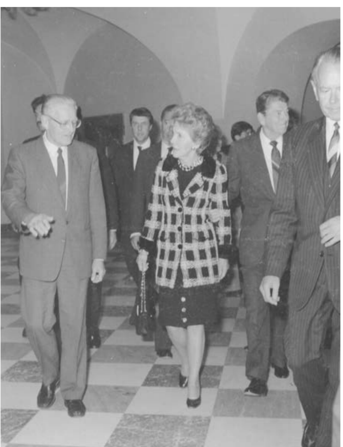
Wizyta prezydenta USA Ronalda Reagana na Zamku Królewskim w Warszawie, 14 września 1990. APAN, ZF, b.p.