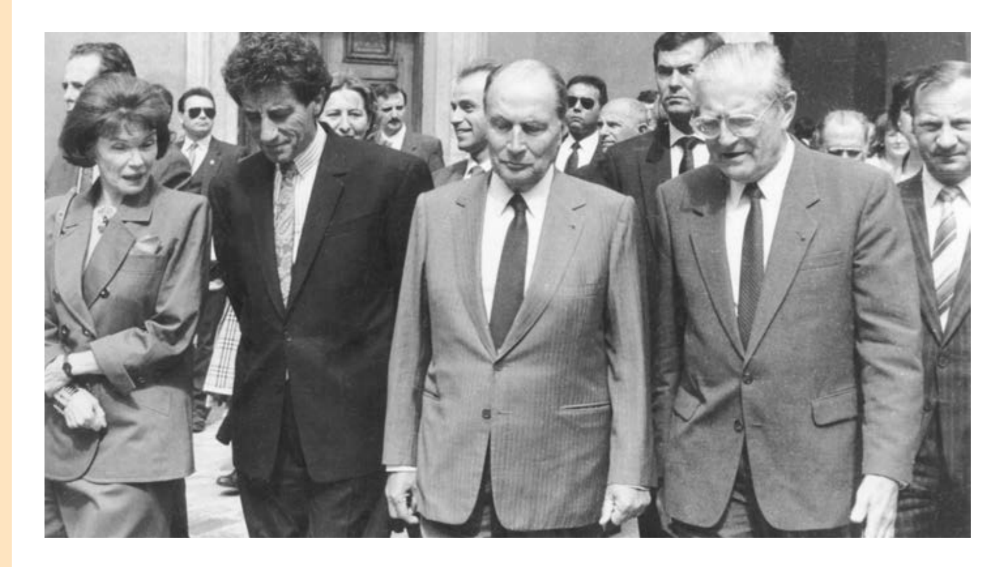
Wizyta prezydenta Francji François Mitterranda na Zamku Królewskim w Warszawie, 15 czerwca 1989.