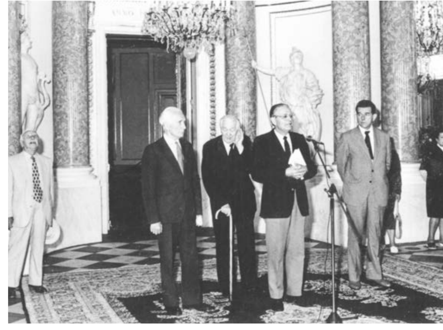
Wizyta członka biura politycznego Węgierskiej Socjalistycznej Partii Robotniczej, premiera Węgier Károly Grósza (2. od lewej) na Zamku Królewskim w Warszawie; przemawia Aleksander Gieysztor, 1987.