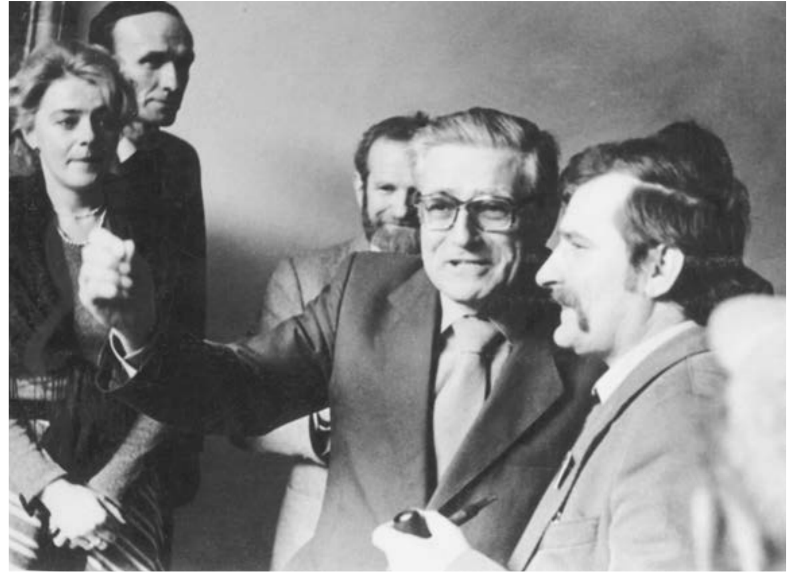
Wizyta przywódcy „Solidarności” Lecha Wałęsy na Zamku Królewskim w Warszawie, 24 marca 1981.