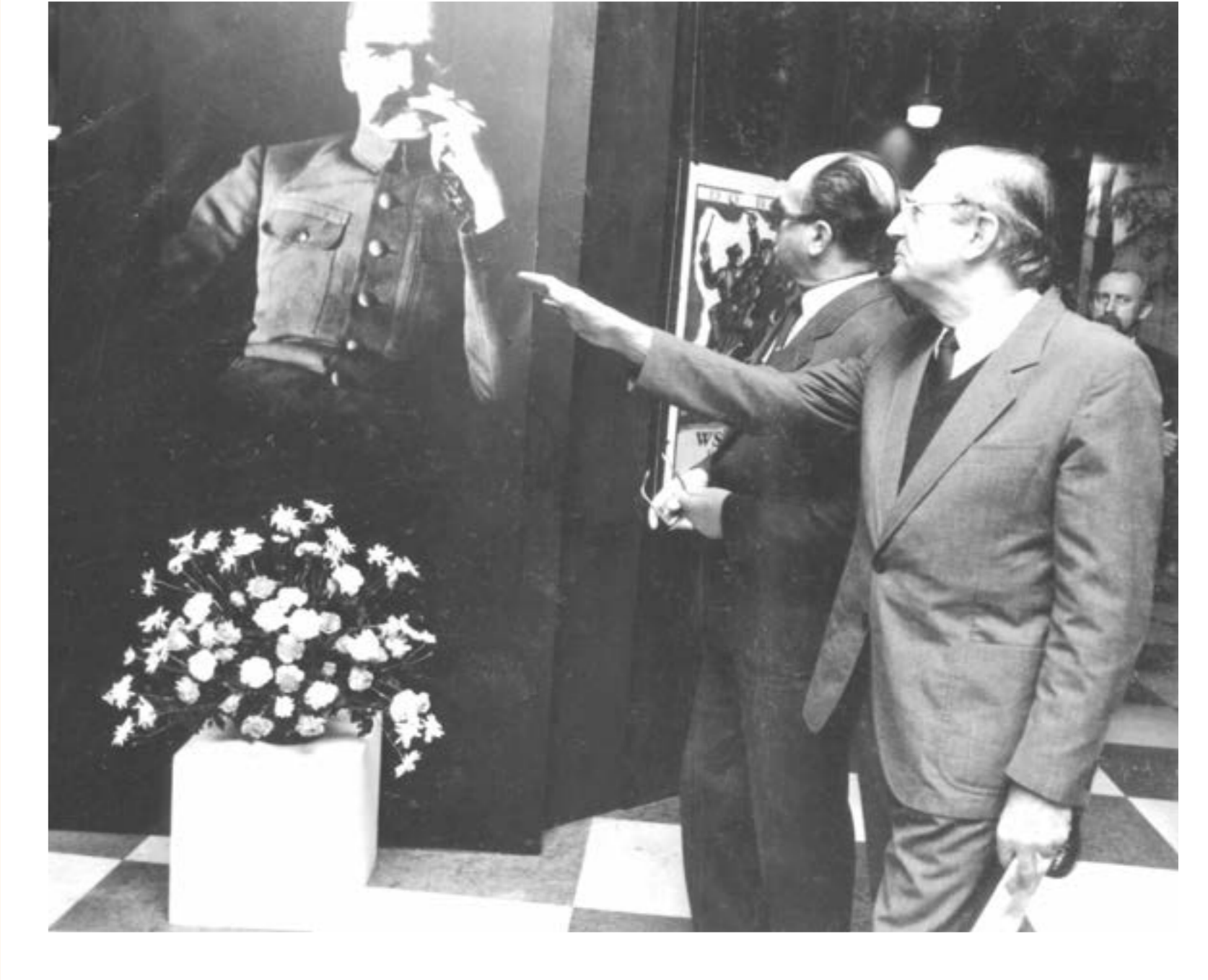
Wizyta przewodniczącego Rady Państwa PRL generała Wojciecha Jaruzelskiego na wystawie Pierwsze dni niepodległości, przygotowanej na Zamku Królewskim w Warszawie z okazji 70. rocznicy odzyskania przez Polskę wolności, grudzień 1988.