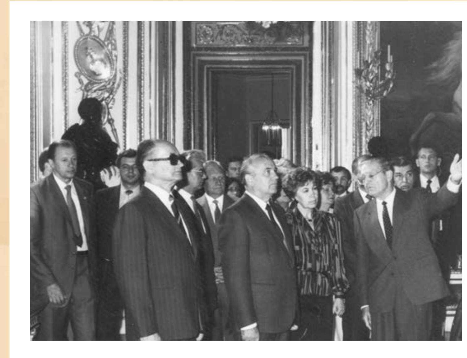
Wizyta generała Wojciecha Jaruzelskiego i ostatniego przywódcy Komunistycznej Partii Związku Radzieckiego, późniejszego jednego z prezydentów ZSRR Michaiła Gorbaczowa na Zamku Królewskim w Warszawie, 1988.