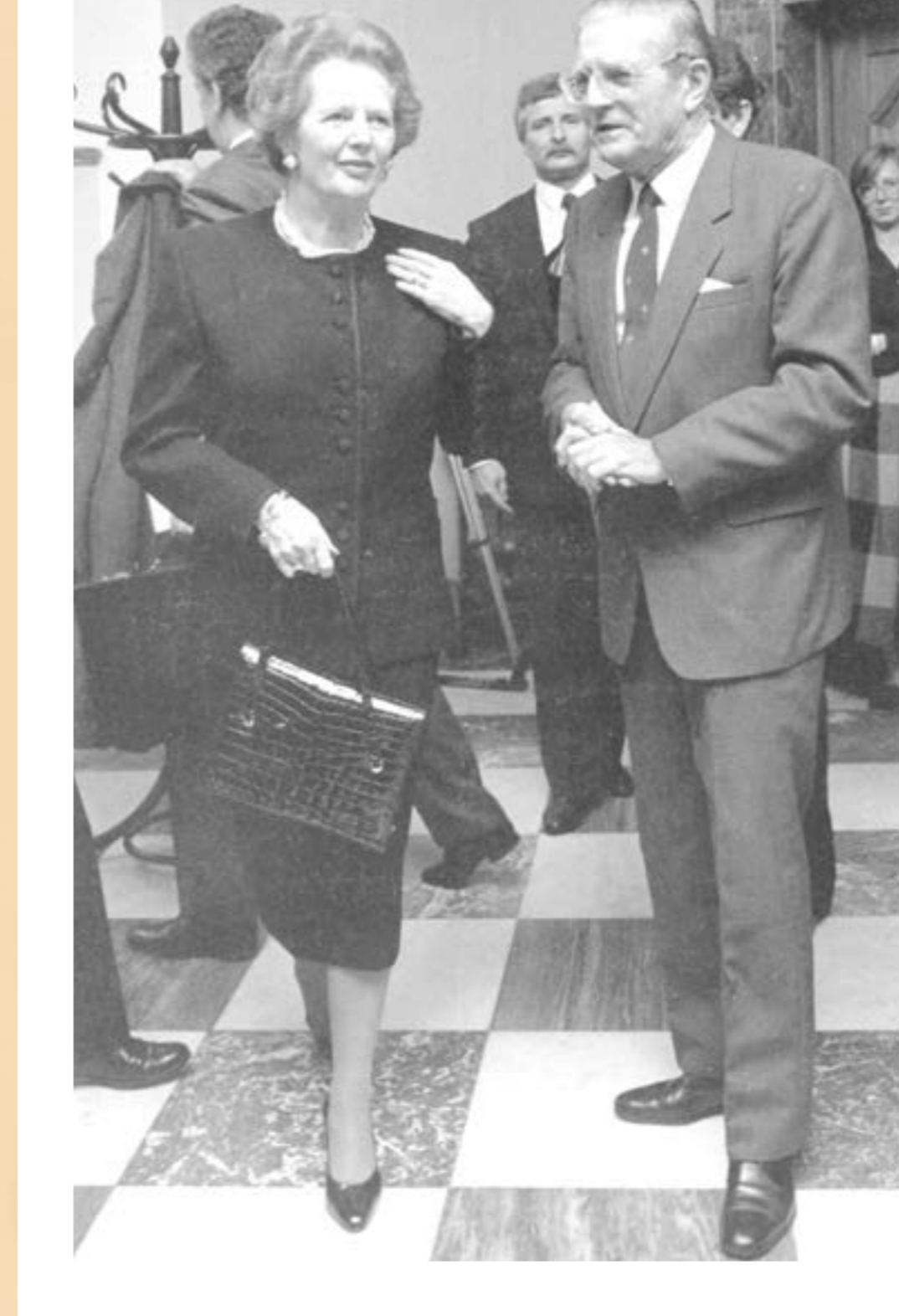
Wizyta premier Wielkiej Brytanii Margaret Thatcher na Zamku Królewskim w Warszawie, 5 listopada 1988.