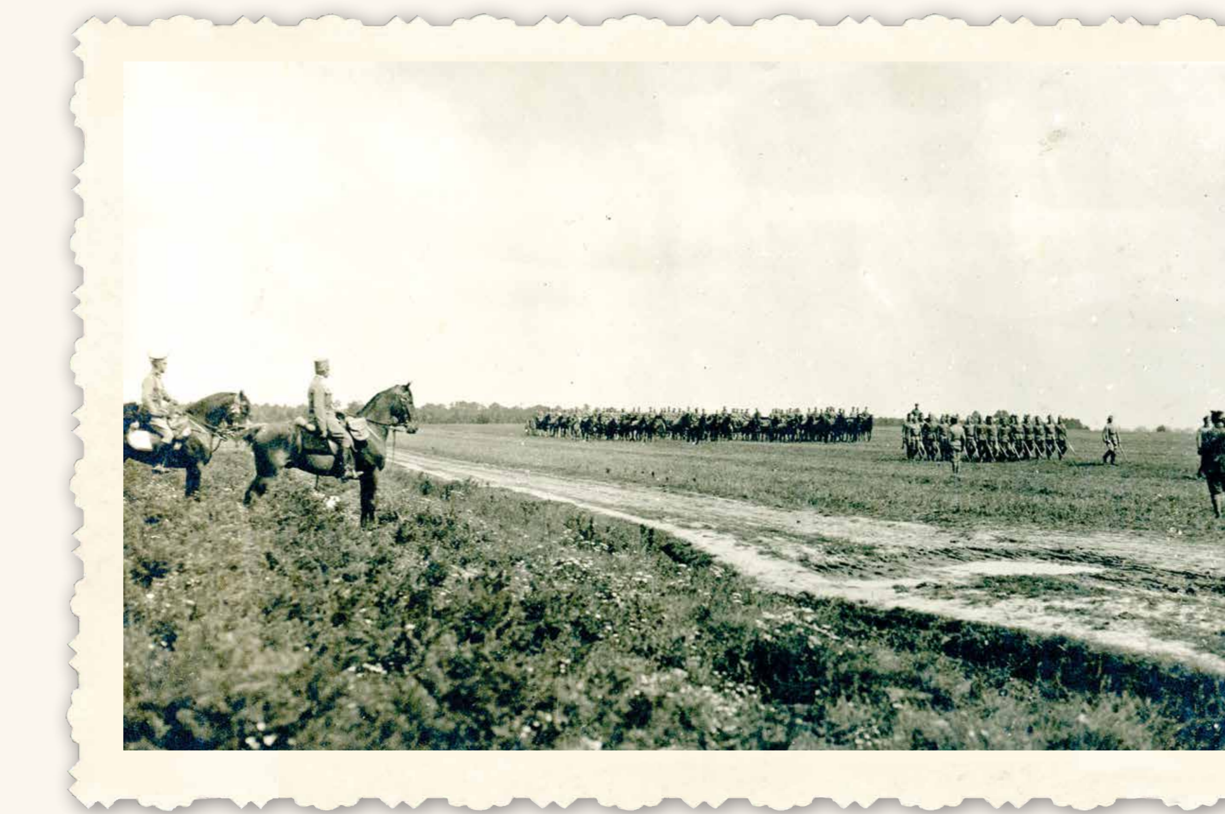
Przeгляд I Dywizji Artylerii Legionów Polskich, 1915, Materiały Władysława Leopolda Jaworskiego, APAN, III-84, j. 28