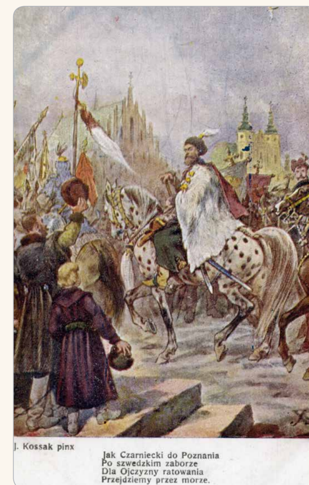
J. Kossak pisał: Jak Czarniecki do Poznania Po szwedzkim zaborze Dla Ojczyzny ratowania Przejdźmy przez morze.