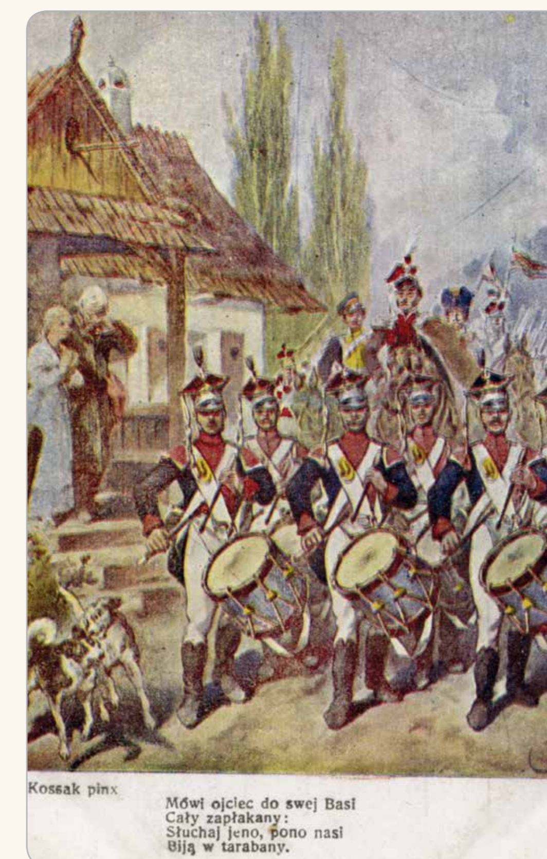
Kossak pisał: Mówi ojciec do swej Basii Cały zapłakany: Szlachetny, ponoć nasz Wuj w tarabany.