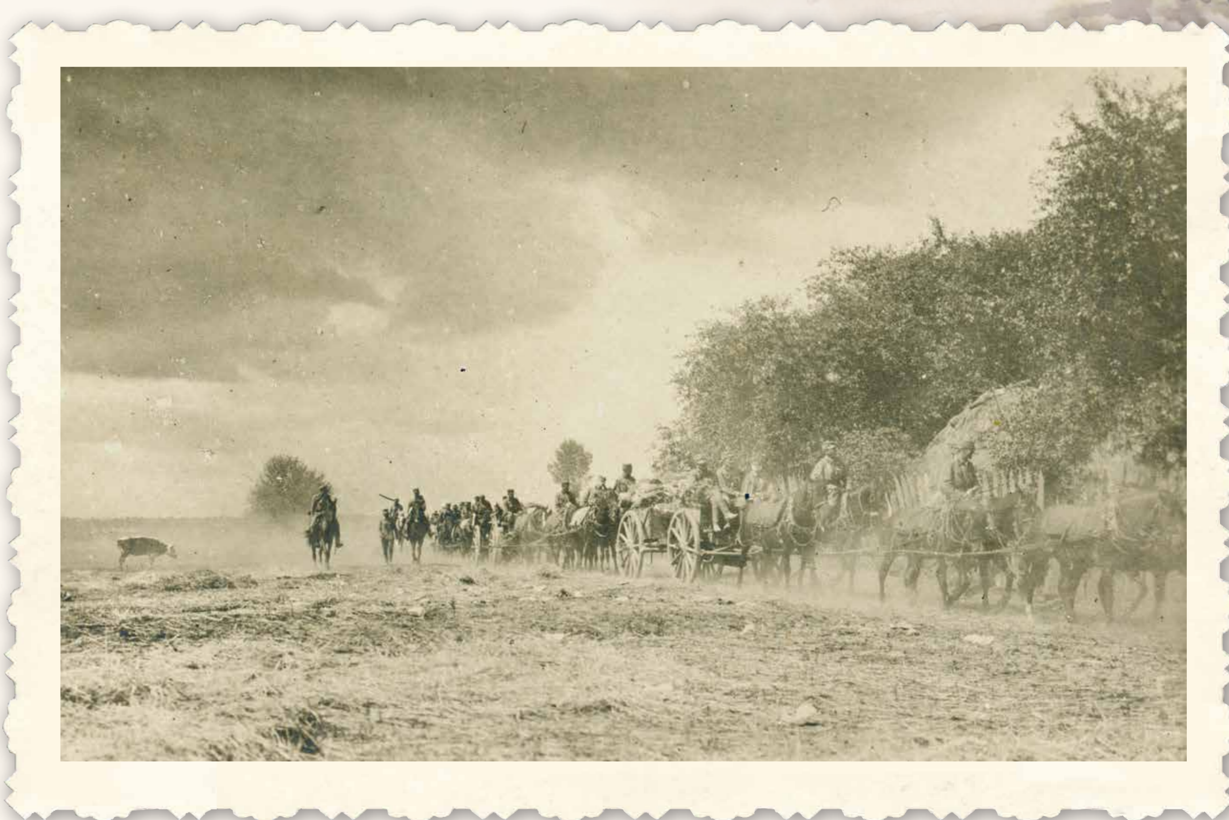
Artyleria I Brygady Legionów Polskich na Wołyniu, 1915, Materiały Władysława Leopolda Jaworskiego, APAN, III-84, j. 28