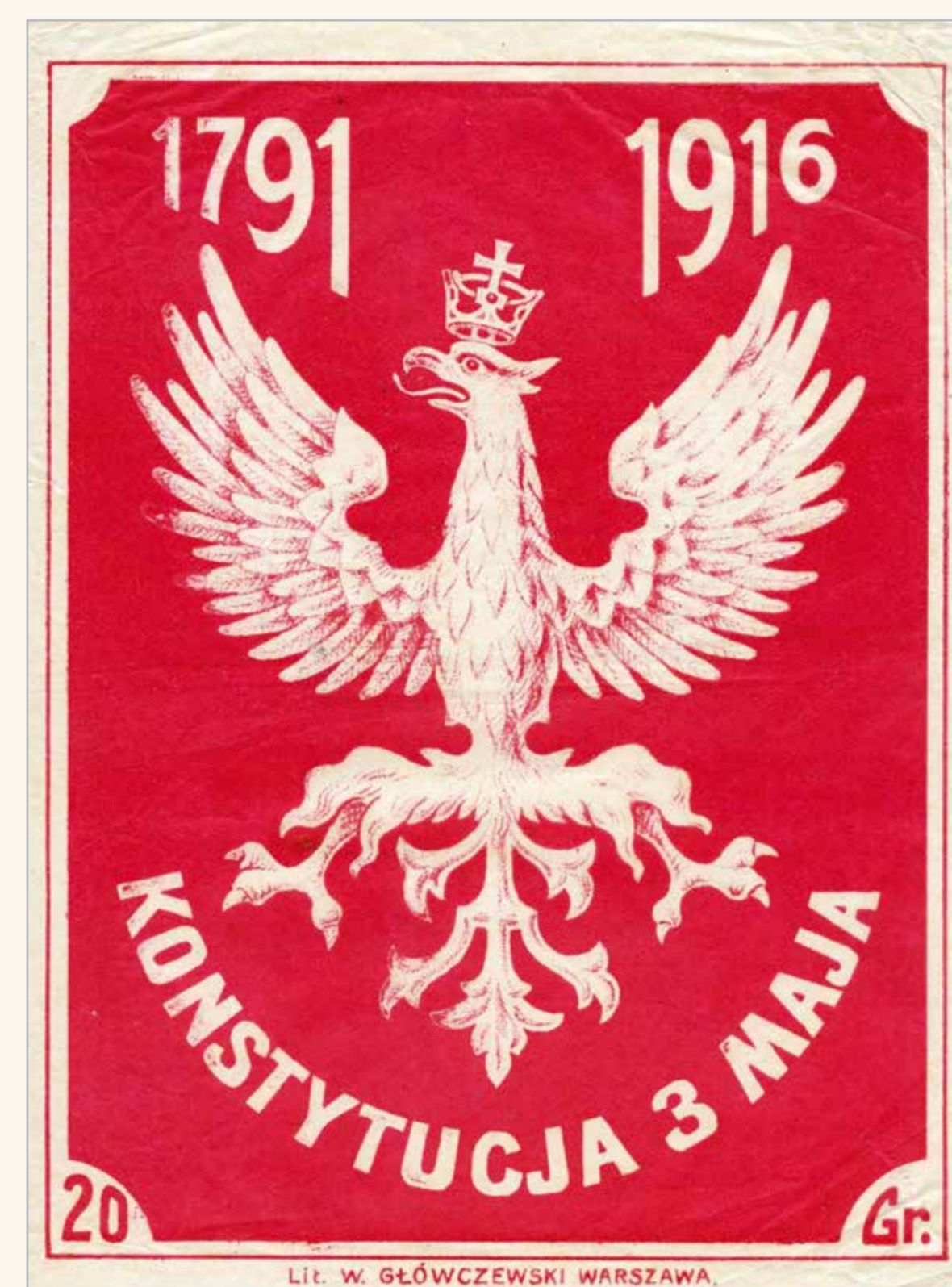
Nalepka sprzedawana na cele dobroczynne, 1916, Materiały Józefa Helczyńskiego, APAN, 25, j. 31