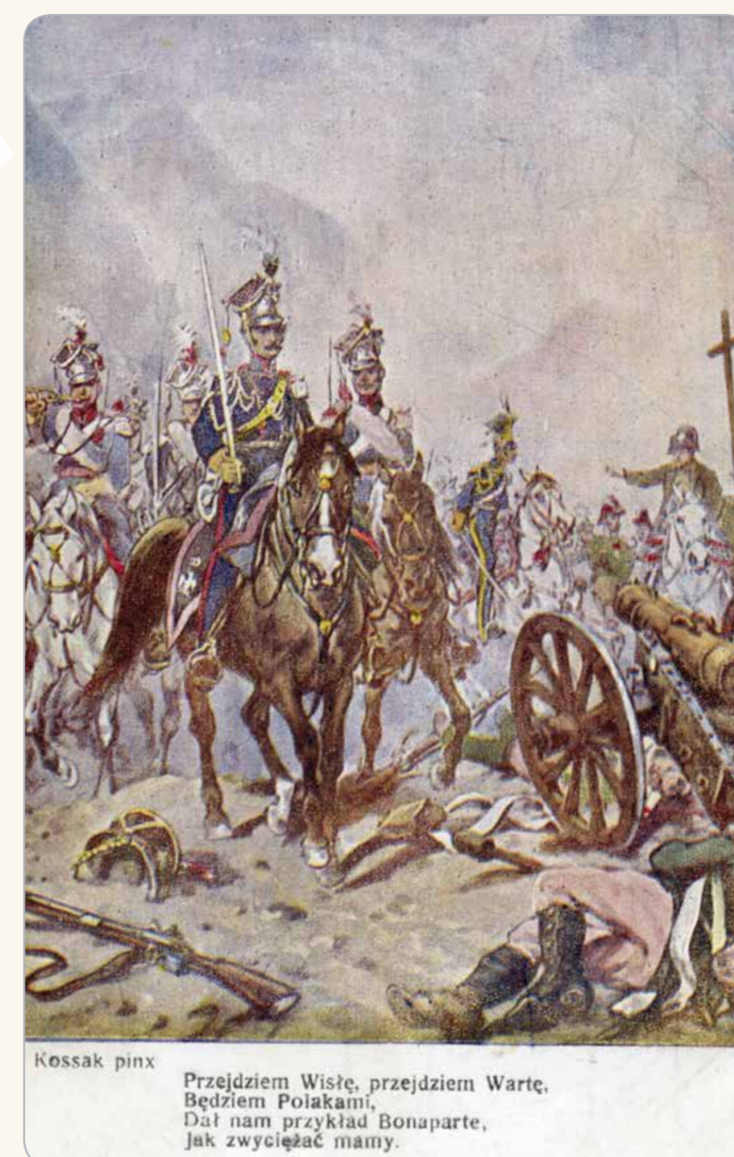
Kossak pisał: Przejdźcie Wiedeń, przejdźcie Warte, bądźcie Polakami! Daj nam przykład Bonaparte, jak zwyciężać mamy.