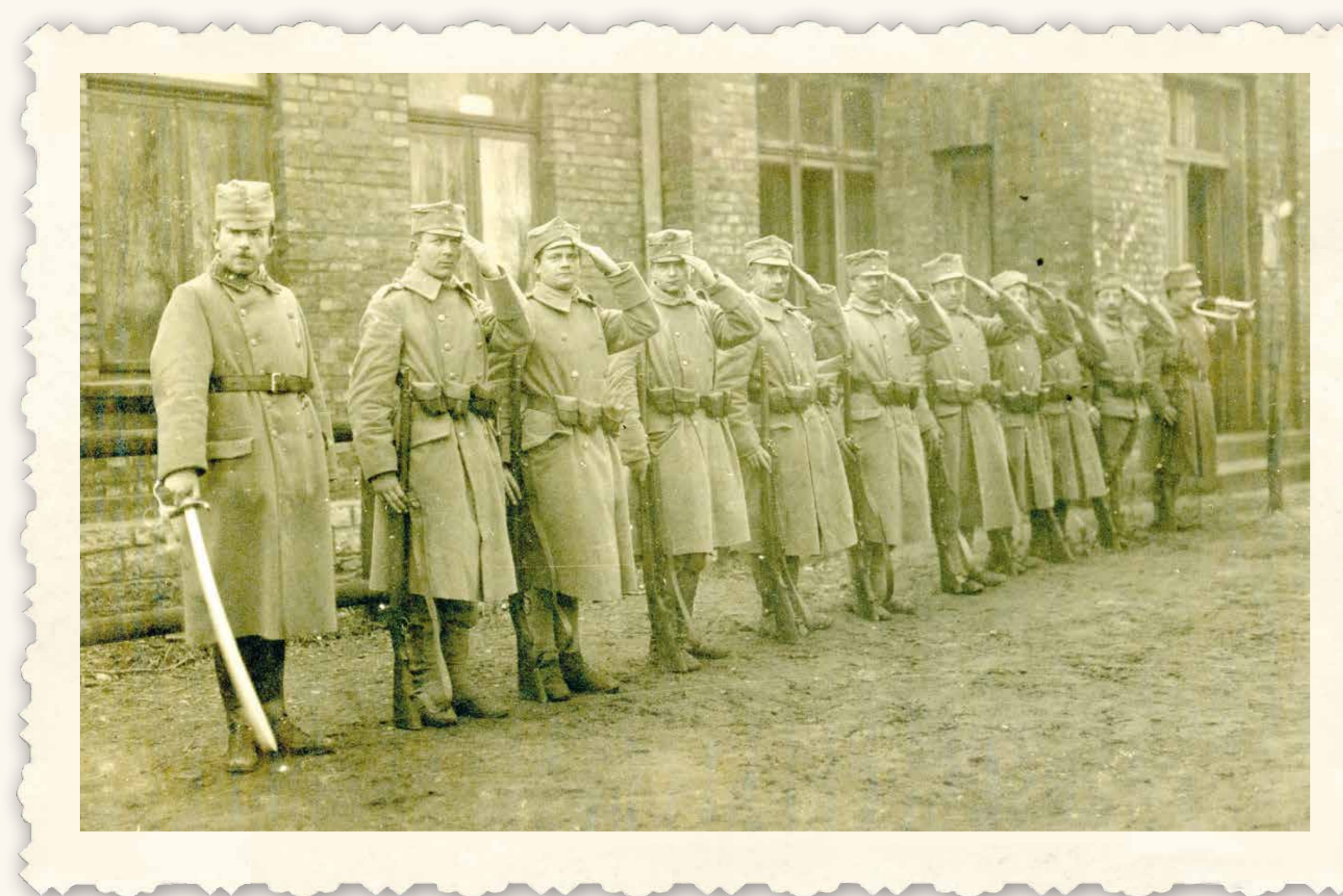
Modlitwa legionistów, 1915, Materiały Władysława Leopolda Jaworskiego, APAN, III-84, j. 28