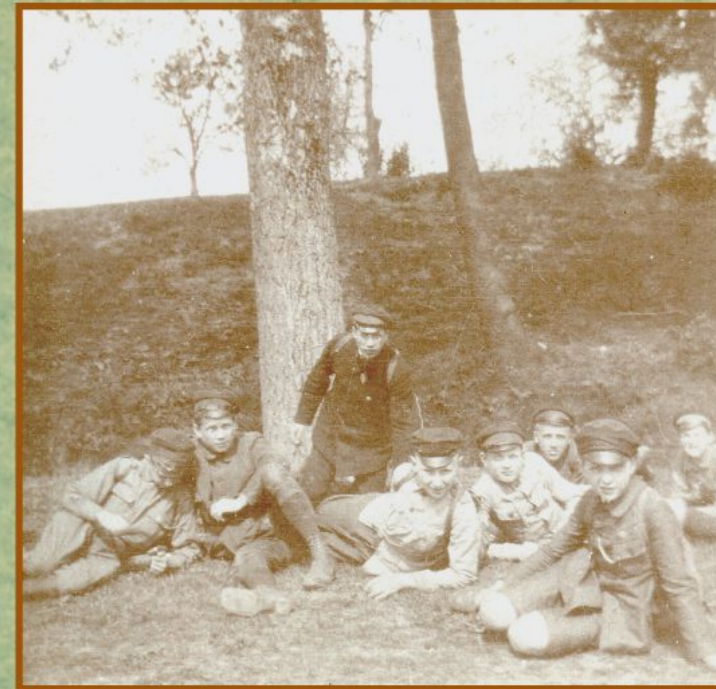
Wycieczka jednego z zastępów 1. Mławskiej Drużyny Harcerzy im. Księcia Józefa Poniatowskiego, około 1918, Materiały Tadeusza Waclawa Korzybskiego, APAN, III-385, j. 63

Pieniądze na obozy i kolonie letnie harcerze zarabiali sami, jednocześnie służąc sobie i innym: „Intensywna, całoroczna praca została uwieczniona pierwszą dwutygodniową kolonią letnią drużyny w leśniczówce Bogdanka w powiecie ciechanowskim. Koszty kolonii pokryła drużyna funduszami zdobytymi bądź to całoroczną pracą, bądź przez urządzenie zabawy kwiatowej w maju 1923 roku.”