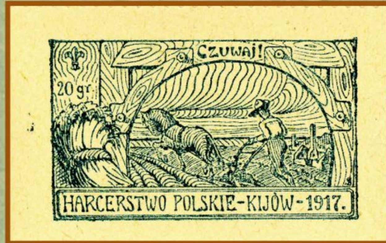
Znaczek dobrowolnych opłat na rzecz Harcerstwa Polskiego w Kijowie; pomoc w polu była jednym ze sposobów zbierania funduszy na harcerskie obozy, 1917, Materiały Józefa Hełczyńskiego, APAN, 25, j. 31