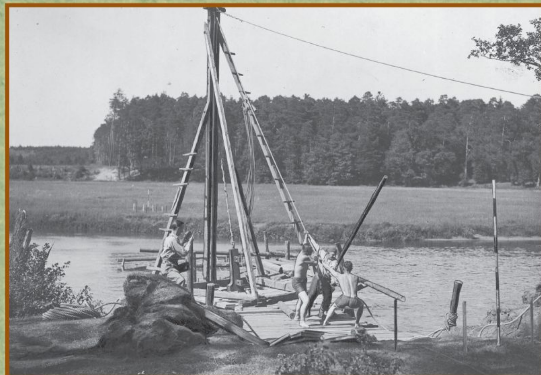
Jubileuszowy Zlot 25-lecia Harcerstwa w Spale; skauci pracują przy budowie przeprawy mostowej na rzece Pilicy, lipiec 1935, NAC, 1-M-478-145, fot. Jan Ryś