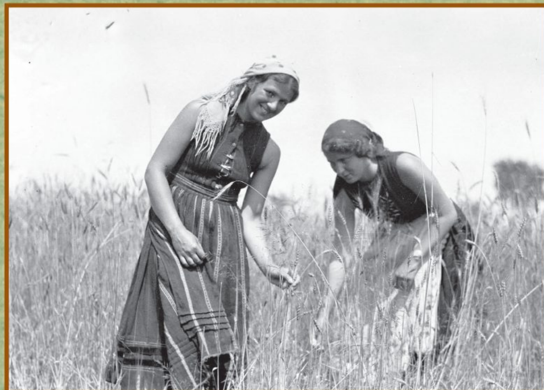
Obóz ZHP w Nowym Sączu; harcerki w strojach ludowych pomagają przy żniwach, lipiec 1933, NAC, 1-P-588-46