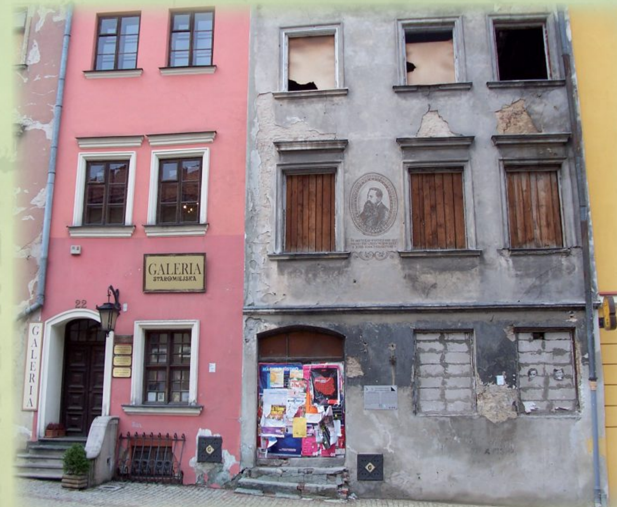
Dom przy ul. Grodzkiej 22 w Lublinie z tablicą pamiątkową, w którym mieszkał Józef Ignacy Kraszewski w latach 1826–1827, 2012

„Cielutki prawie Lublin nosi kapelusze słomkowe à la bergère [...], bardzo ładne i bardzo tanie... A co to będzie z tym, że babunia sama przyznawała mi potrzebę kapelusza, którego nie mam, i podobno obejść się muszę, pomimo nawet surażerki mocno podartej. [...] Ale! Przypomniałem sobie: co tu wiśni w Lublinie.