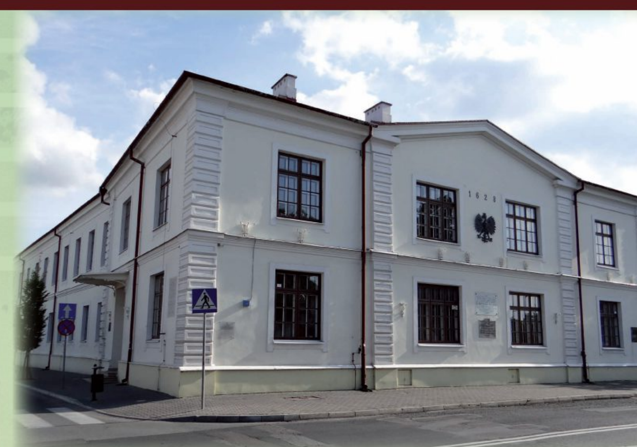
Liceum Ogólnokształcące im. Józefa Ignacego Kraszewskiego przy ul. Kraszewskiego 1 w Białej Podlaskiej z tablicą pamiątkową wmurowaną z okazji 100. rocznicy śmierci pisarza; placówka ta działała od 1628 roku, w obecnym kształcie od 1919; absolwentami „Kraszaka” byli m.in.: krytyk muzyczny Bogusław Kaczyński, polityk profesor Krzysztof Skubiszewski, aktorzy Roman Kłosowski i Wacław Kowalski, 2012, fot. Jolanta Dyr, http://www.commons.wikimedia.org , Akademia Białka w Białej Podlaskiej, 20 października 2012