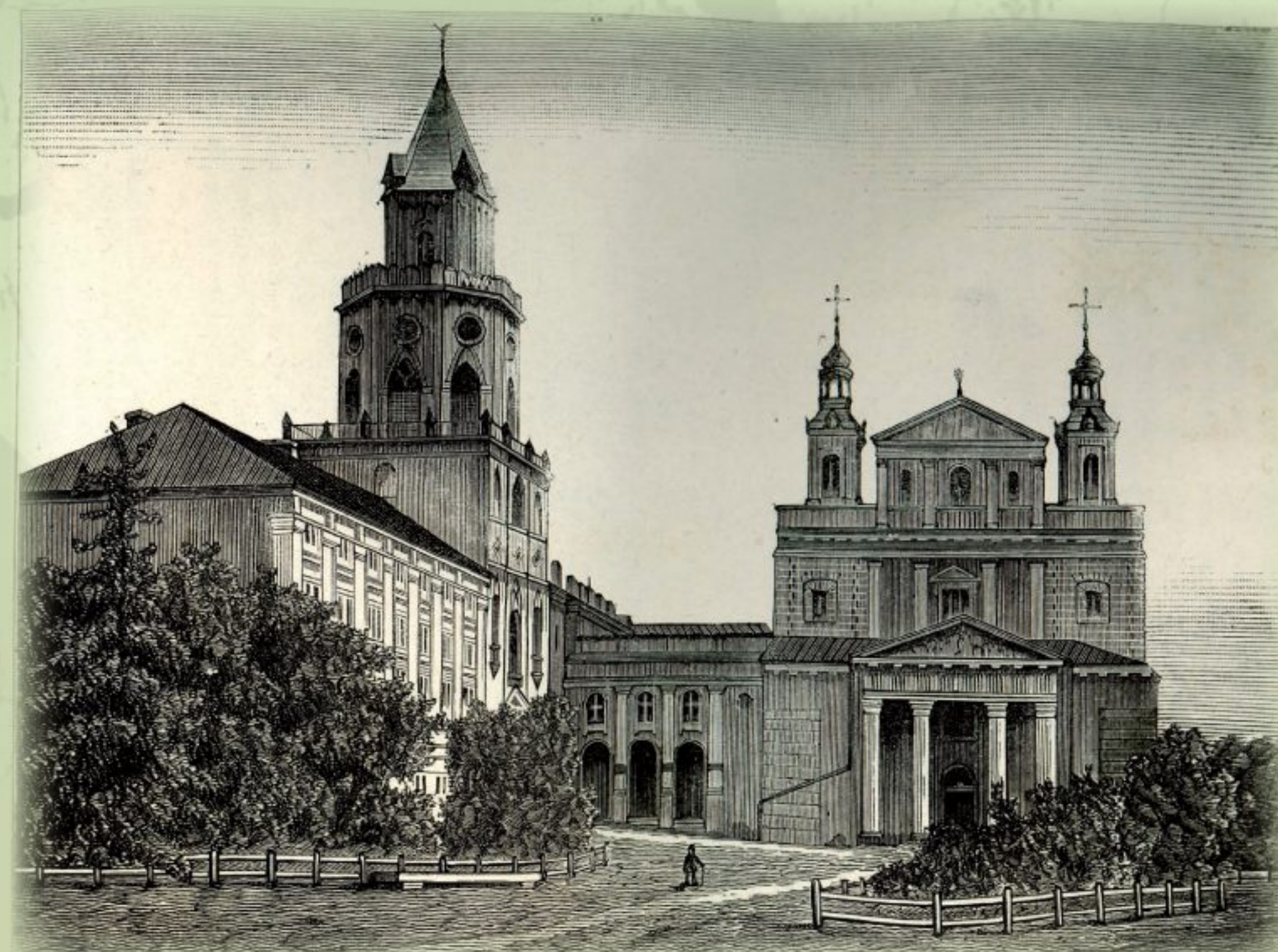
Brama Trynitariska i gmach szkoły wojewódzkiej w Lublinie, gdzie uczył się Józef Ignacy Kraszewski w latach 1826–1827, b.d., Książka...