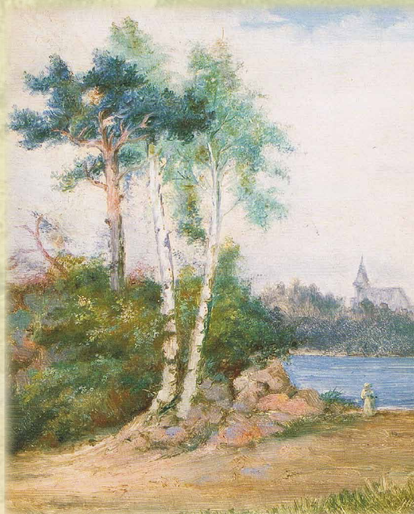
Józef Ignacy Kraszewski, Krajobraz z brzoźami, obraz olejny na płótnie, b.d., MR