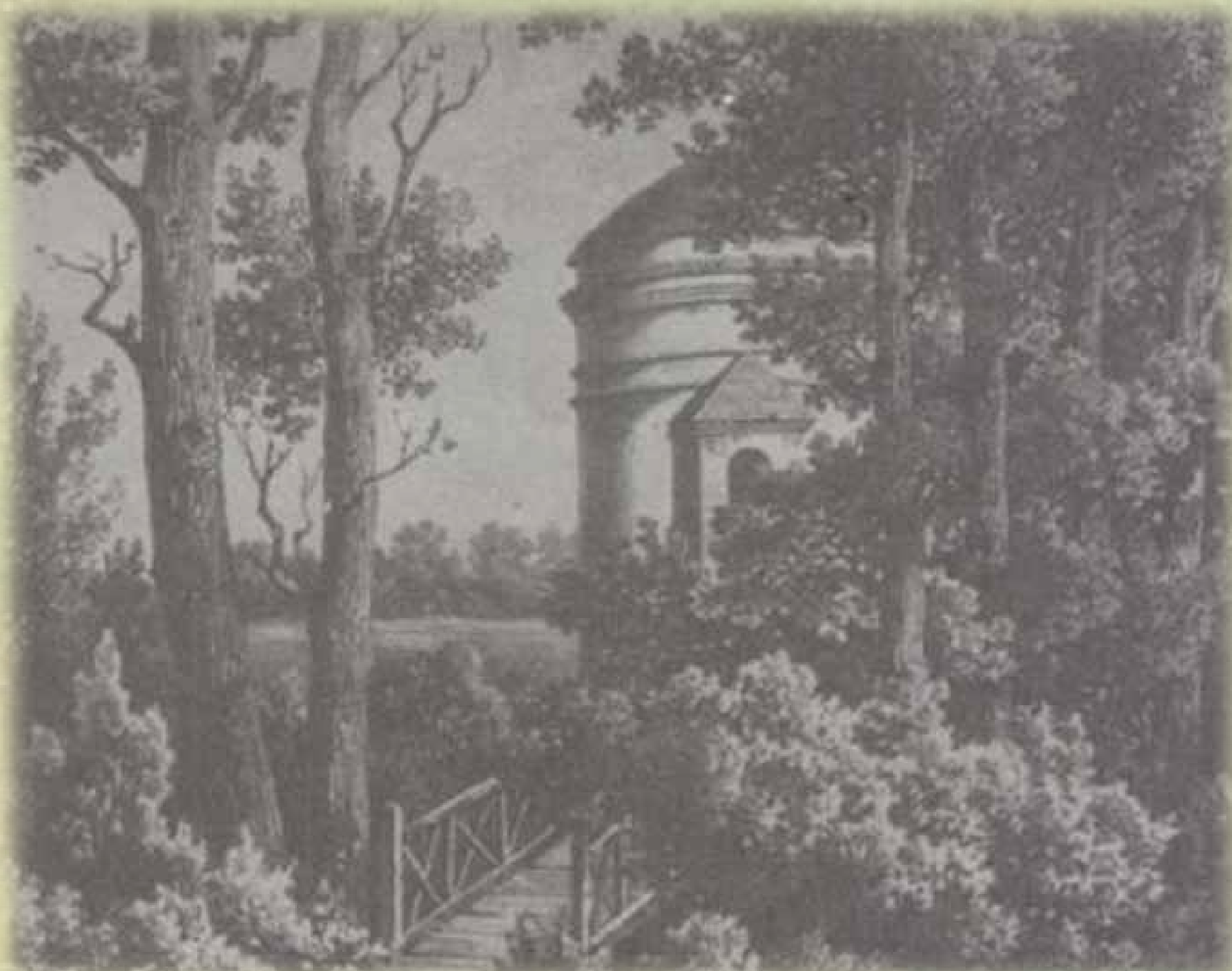
Józef Ignacy Kraszewski, Kaplica w Romanowie, rysunek ołówkiem, b.d., „Gościńiec”, 1987, nr 4, s. 19, http://www.rybnik.pl/bsip/publik/Kraszewski.pdf , 20 października 2012