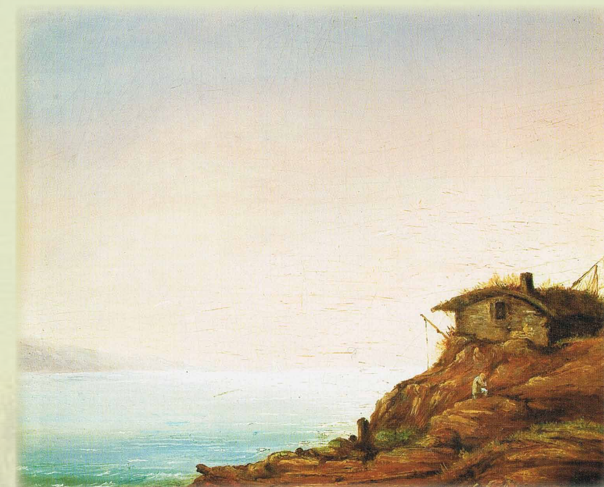
Józef Ignacy Kraszewski, Chata nad wodą, obraz olejny na płótnie, b.d., MR