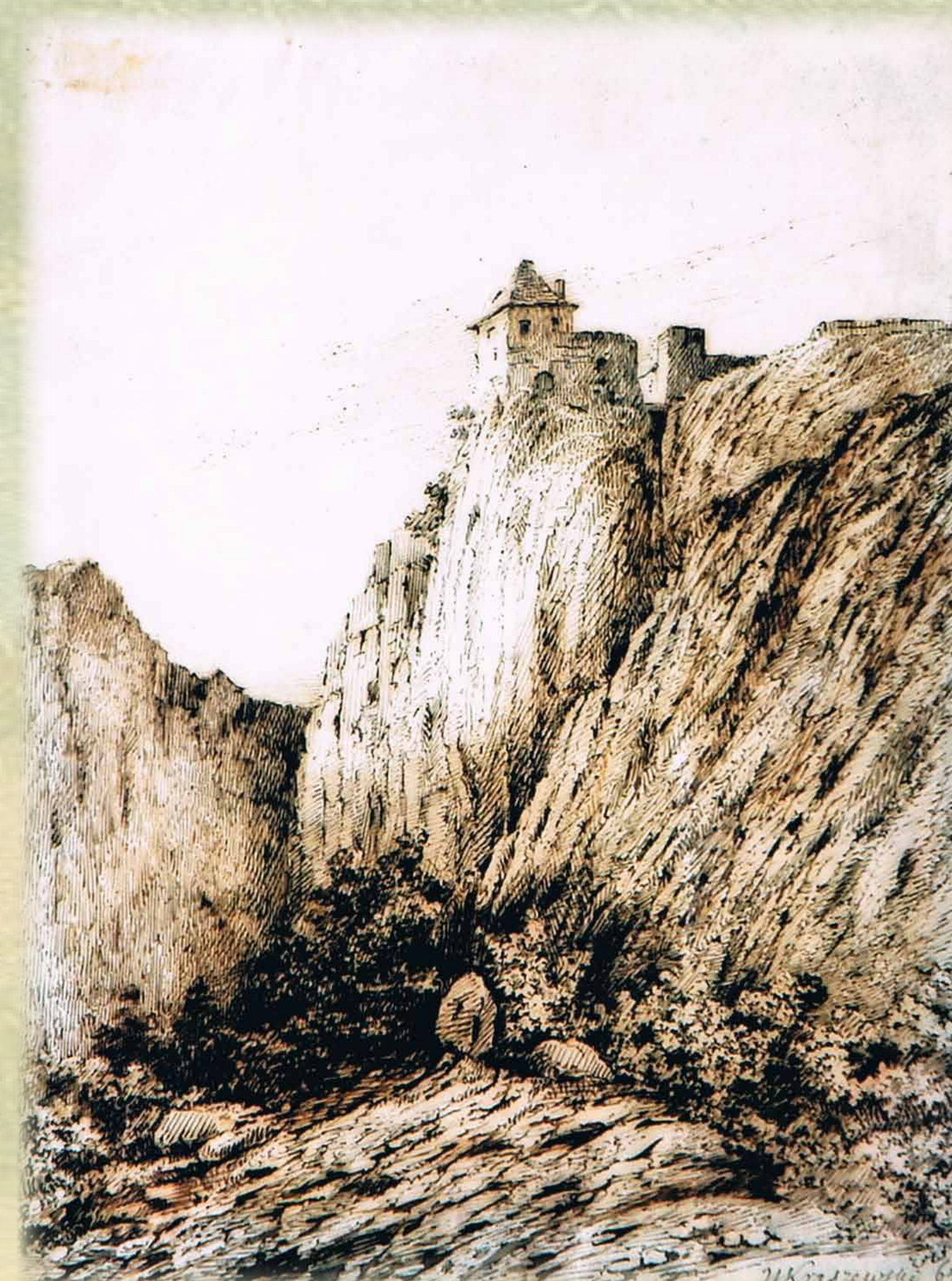
Józef Ignacy Kraszewski, Pejzaż z zamkiem, rysunek, 1864, MR