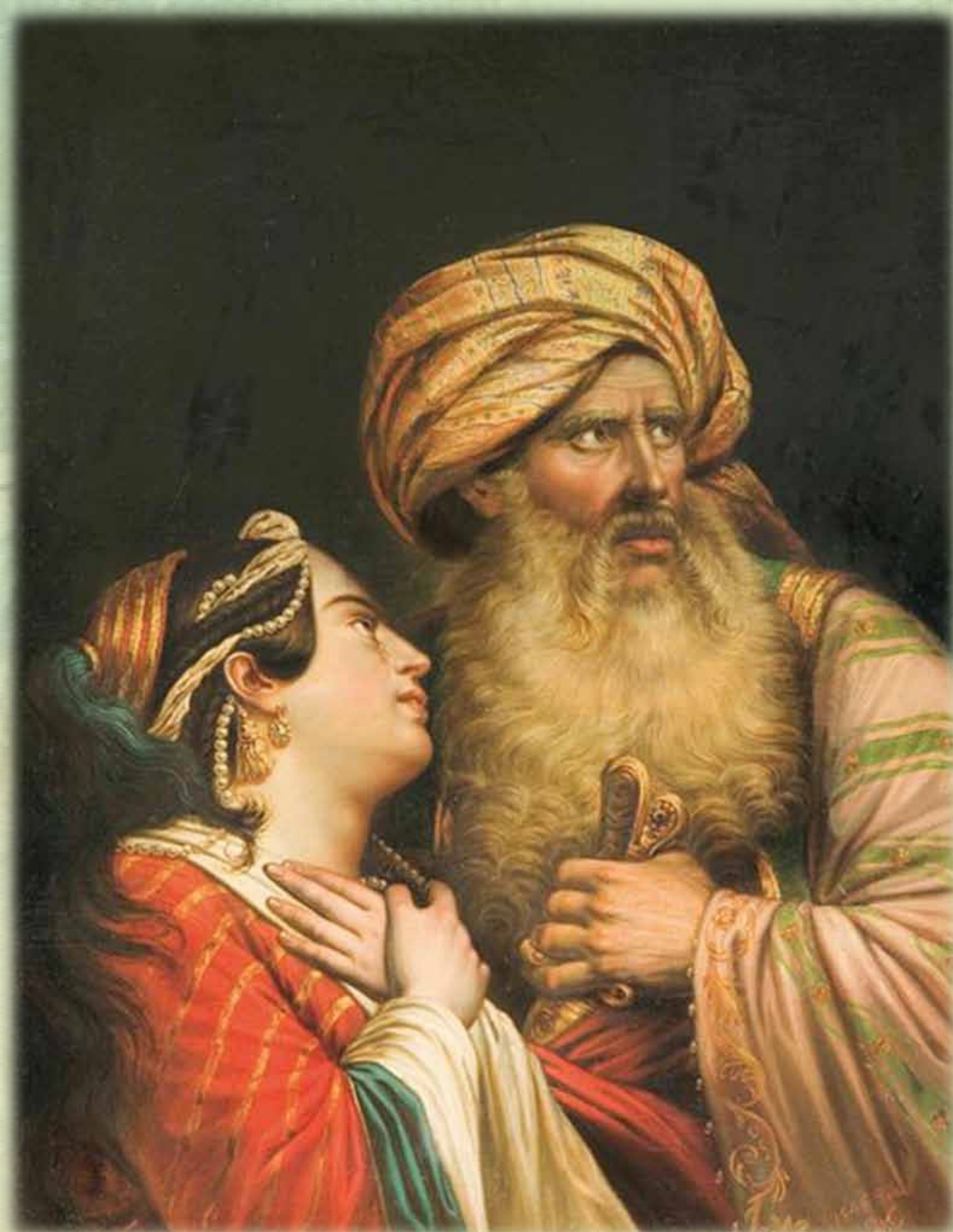
Józef Ignacy Kraszewski, Portret wschodni, obraz olejny na płótnie, 1846, http://artyzm.com/obraz.php?id=3409 , 20 października 2012