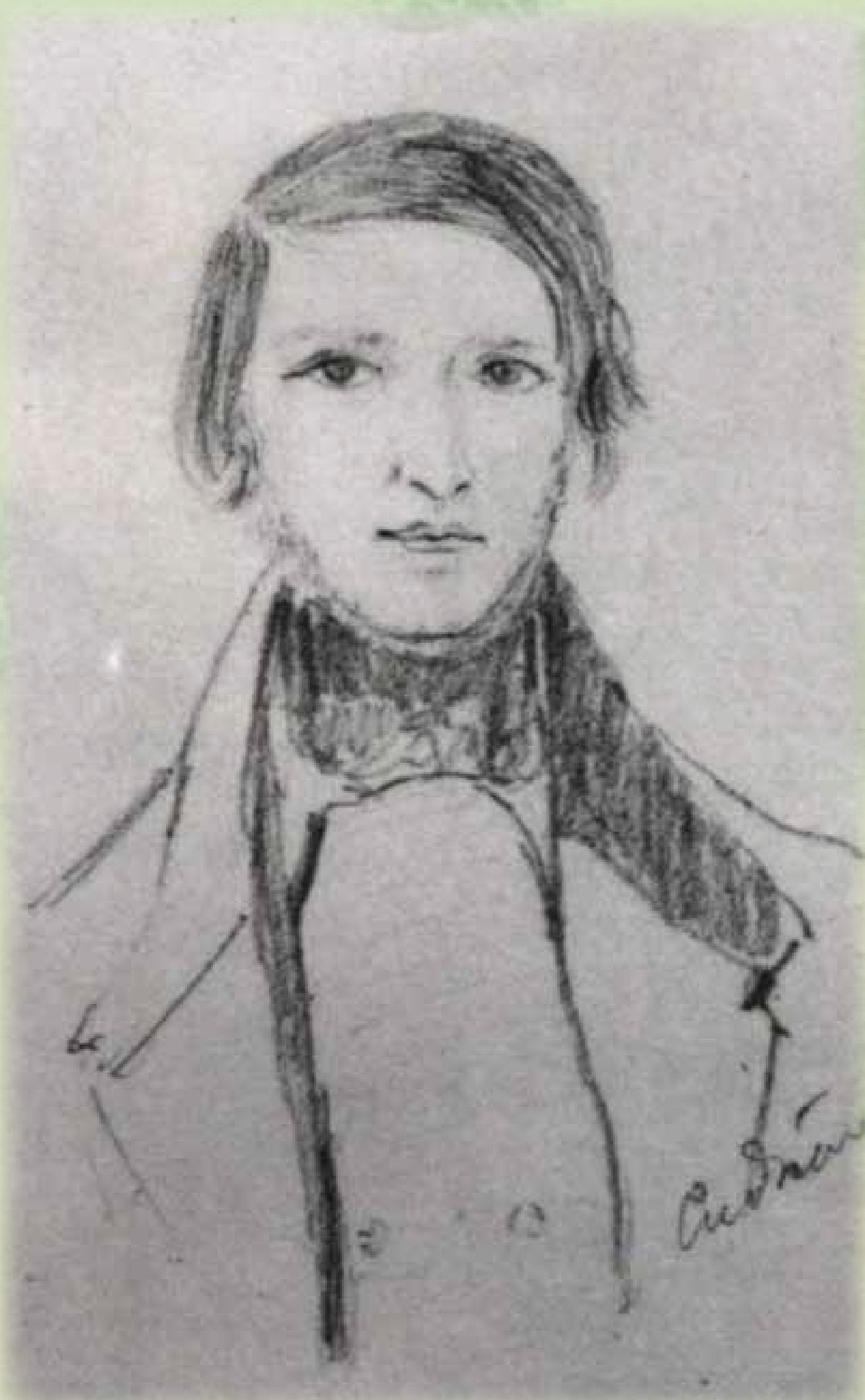
Autoportret Józefa Ignacego Kraszewskiego, 1844, http://www.kraszak.bialapodl.pl/dok , 20 października 2012