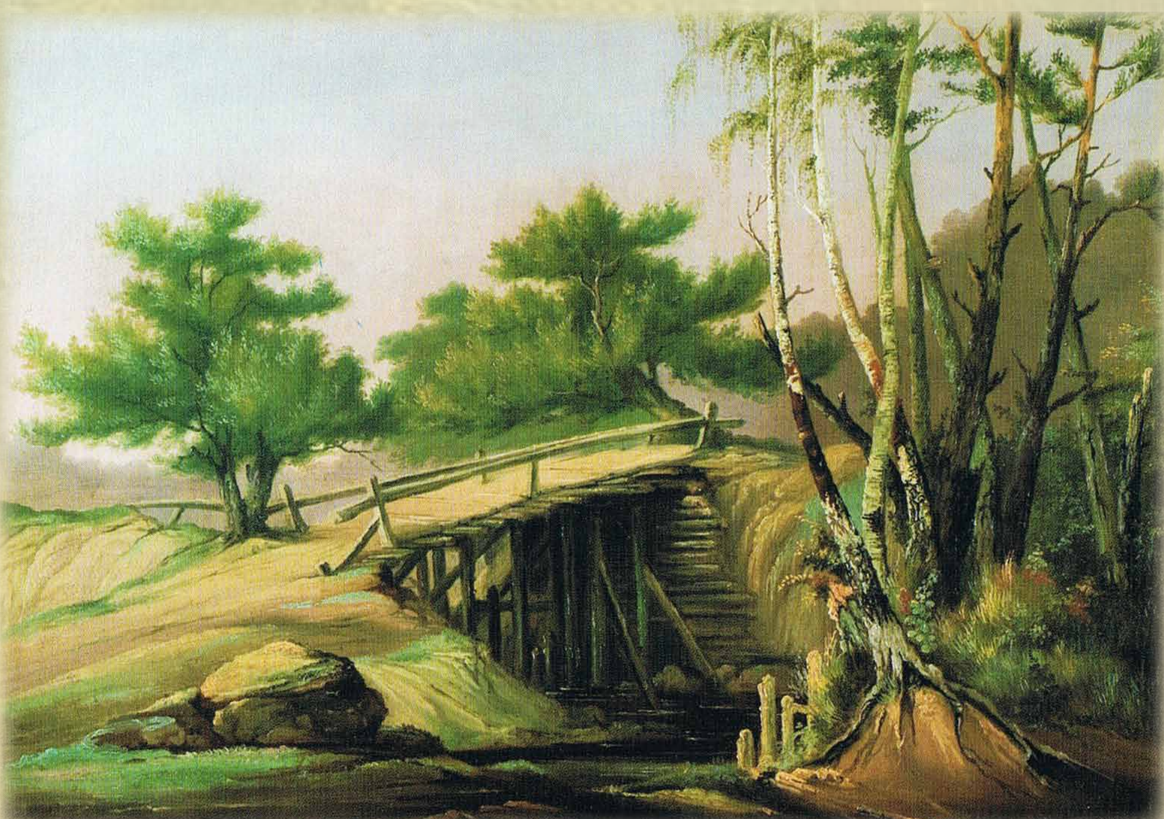
Józef Ignacy Kraszewski, Krajobraz wołyński, obraz olejny na płótnie, 1854, MR

malaryz Palę się do malarstwa teraz, ale mi czasu brak