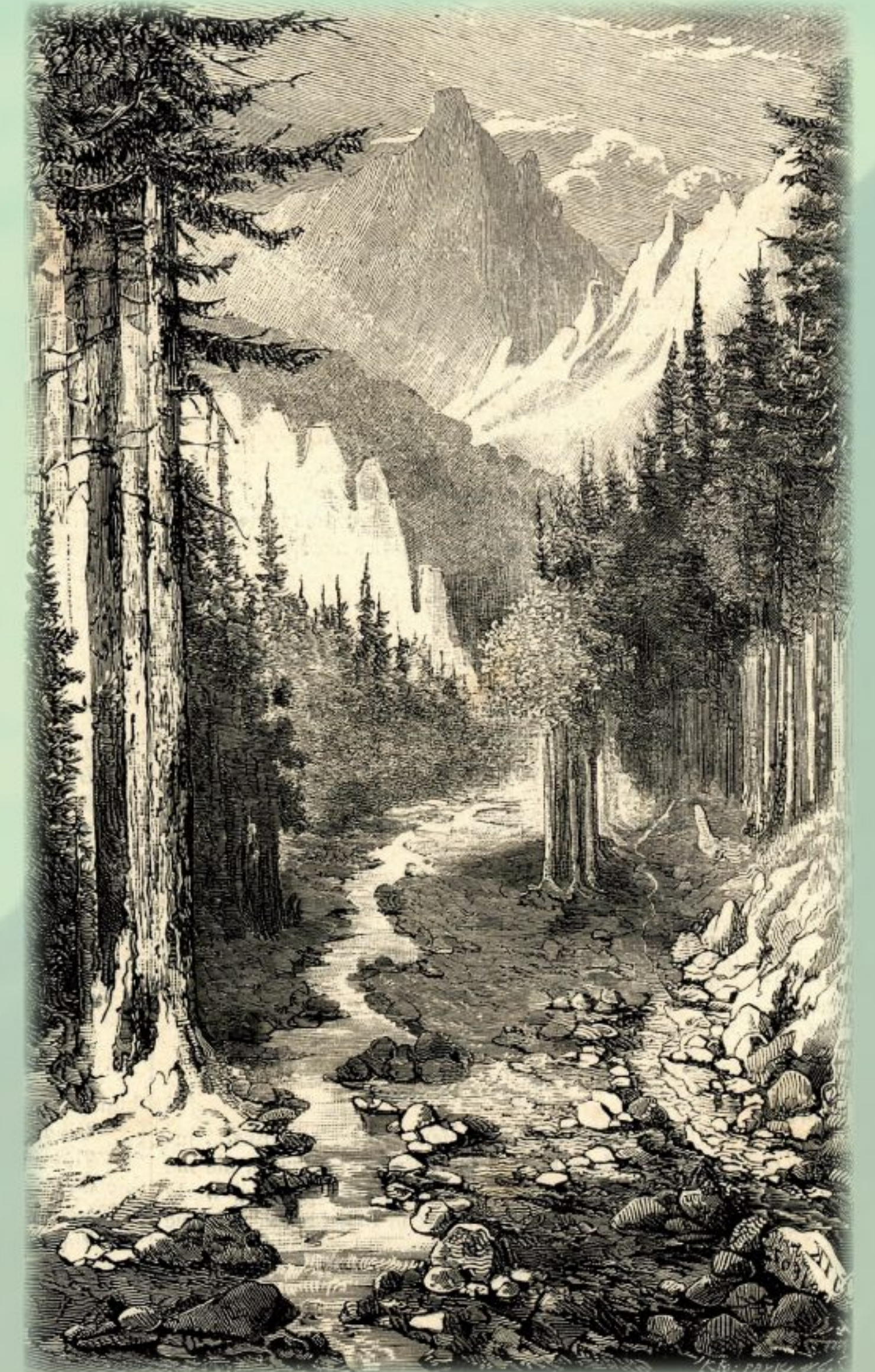
Józef Ignacy Kraszewski, Widok Tatrów. Dolina Strążyńska, Józef Ignacy Kraszewski, Z wycieczki do Tatrów, „Kłosy”, 29 sierpnia/10 września 1868, nr 167

O godzinie 7 rano dwa moździerze, ustawione około gospody Towarzystwa, dały sygnał, że tegoż dnia uroczystość się odbędzie. Ruch w całym Zakopanem rozpoczął się wielki, wozy zjeżdżają z wszystkich stron, muzyka sprowadzona z Kuźnic zjawia się o godzinie 9, następnie o godzinie 10 wzywają wszystkie dzwony w parafialnym kościele do wzniesienia modłów za czcigodnego Jubilata. [...] Po ukończeniu nabożeństwa wyruszyły o godzinie wpół do 12 liczne wozy przybrane w zieleń do Doliny Kościeliskiej. Tutaj przy udziale licznych gości [...] rozpoczęła się właściwa uroczystość o godzinie 1. Wiceprezes Towarzystwa pan Władysław Ludwik Anczyz zaprosił księdza kanonika Józefa Martusiewicza, profesora teologii w Tarnowie i delegata do Rady Państwa, aby odbył akt uroczysty poświęcenia pomnika. Po dokonaniu tego straż tatrzańska uzbrojona w karabinki dała wystrzałem znak strzelcom ustawionym z moździerzami na jednym skrzydle „Bramy Kraszewskiego”. Moździerze zajęły hukiem rozlegającym się w obszernej dolinie - muzyka zagrała pieśń ludową.