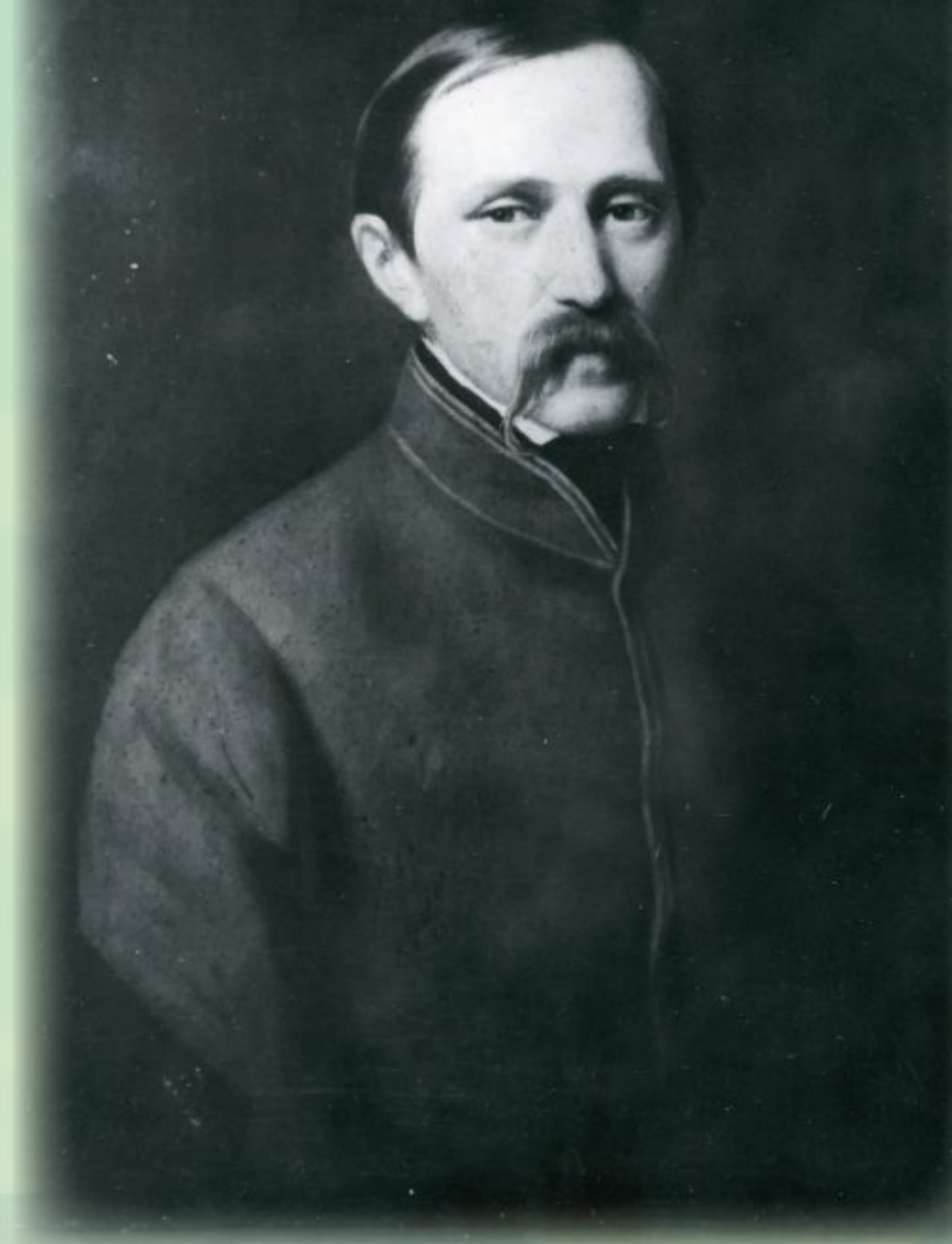
Józef Ignacy Kraszewski, ok. 1851, APAN, ZF, XII-31, k. 1