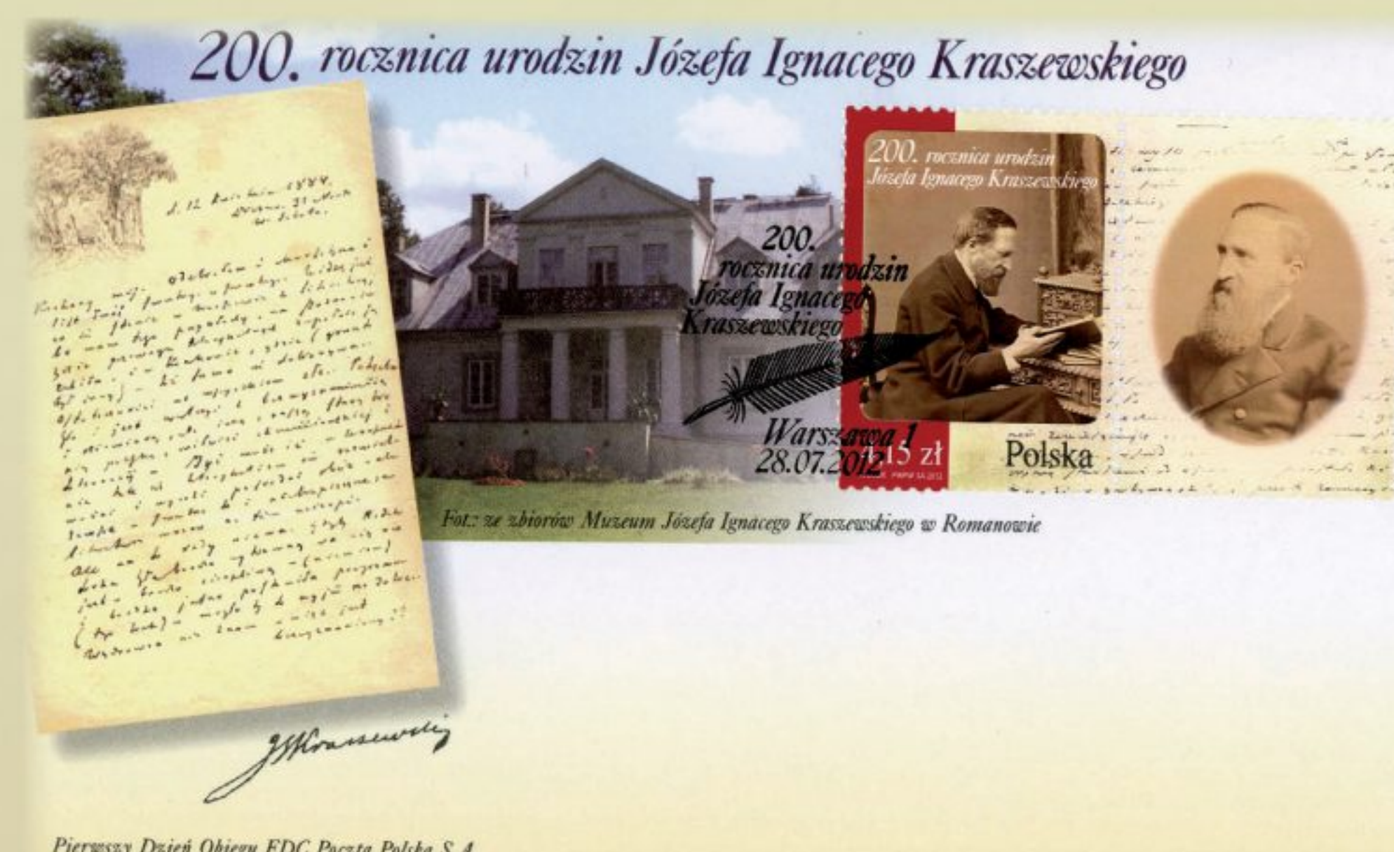
Pierwszy Dzień Obiegu FDC Poczta Polska S.A.