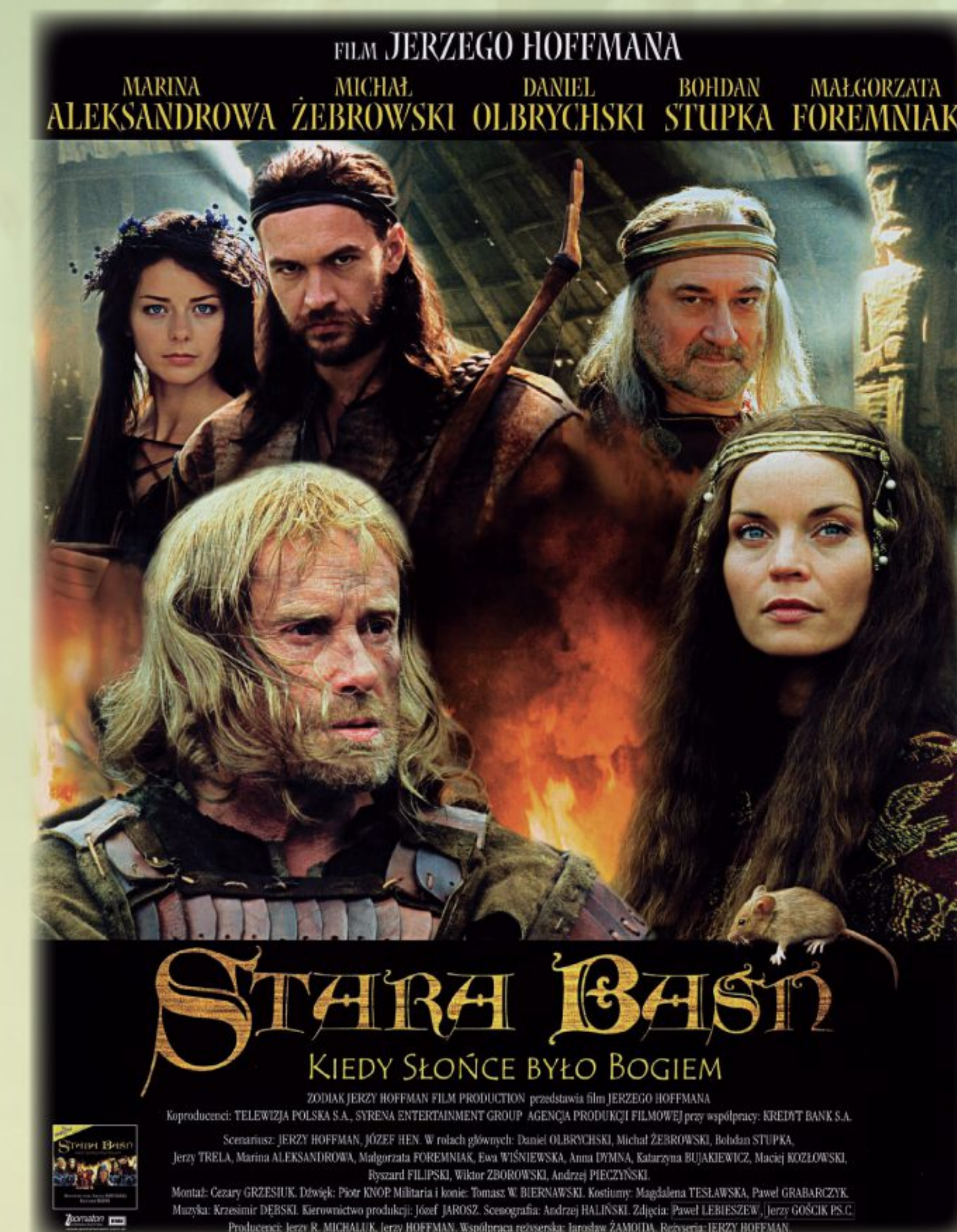
Plakat filmu według powieści Józefa Ignacego Kraszewskiego Stara baśń , 2003, BFN