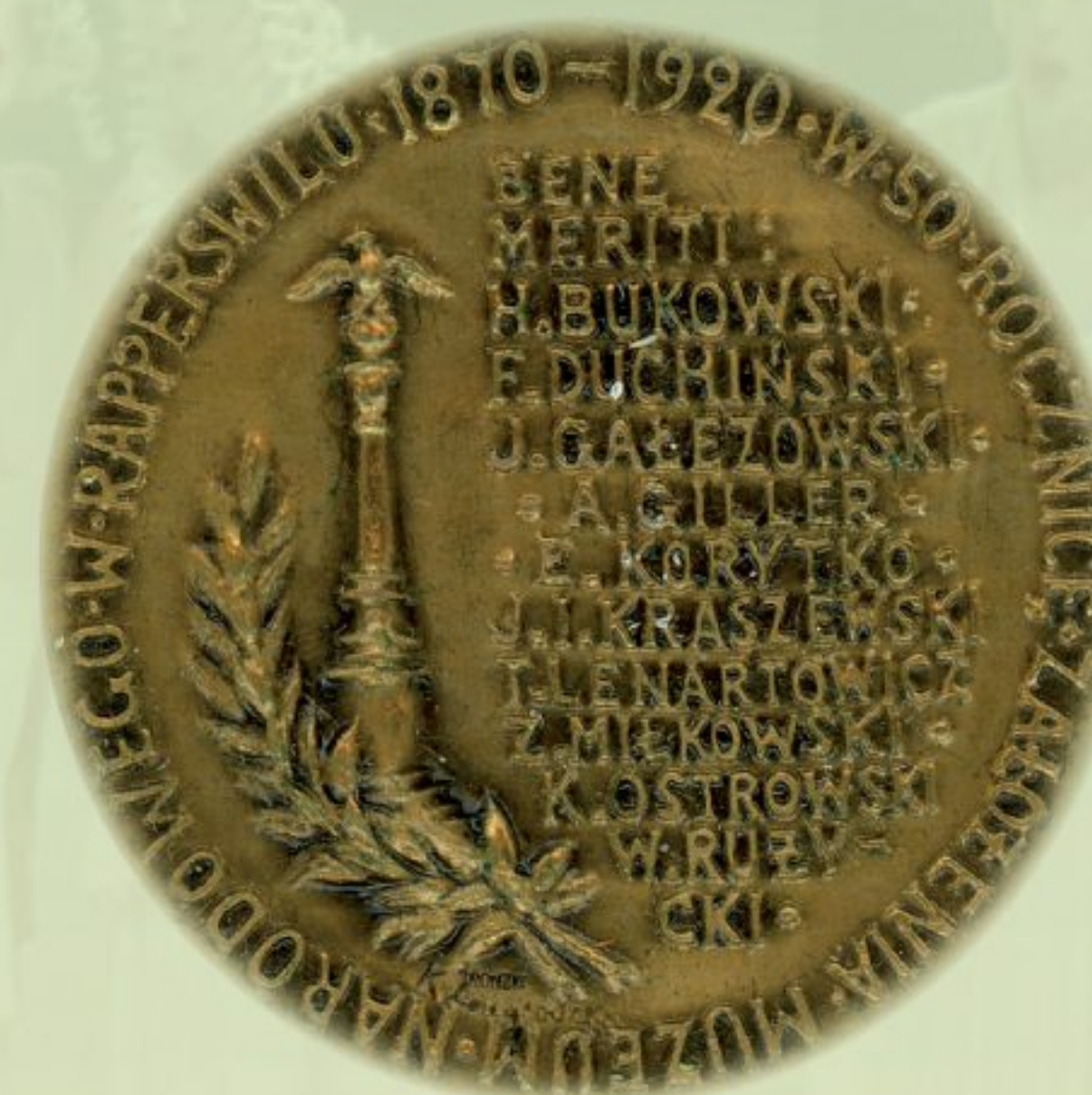
Władysław Plater. Jubileusz 50-lecia Muzeum Polskiego w Rapperswilu, medalier Konstanty Zmigrodzki, 1920, APAN, ZM, 122