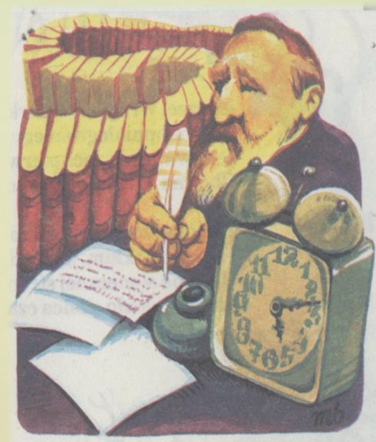
Karykatura Józefa Ignacego Kraszewskiego, litografia Władysława Walkiewicz, rysunek Arkadiusz Mucharski, ok. 1880, http://www.rybnik.pl/bsip/publik/Kraszewski.pdf , 20 października 2012