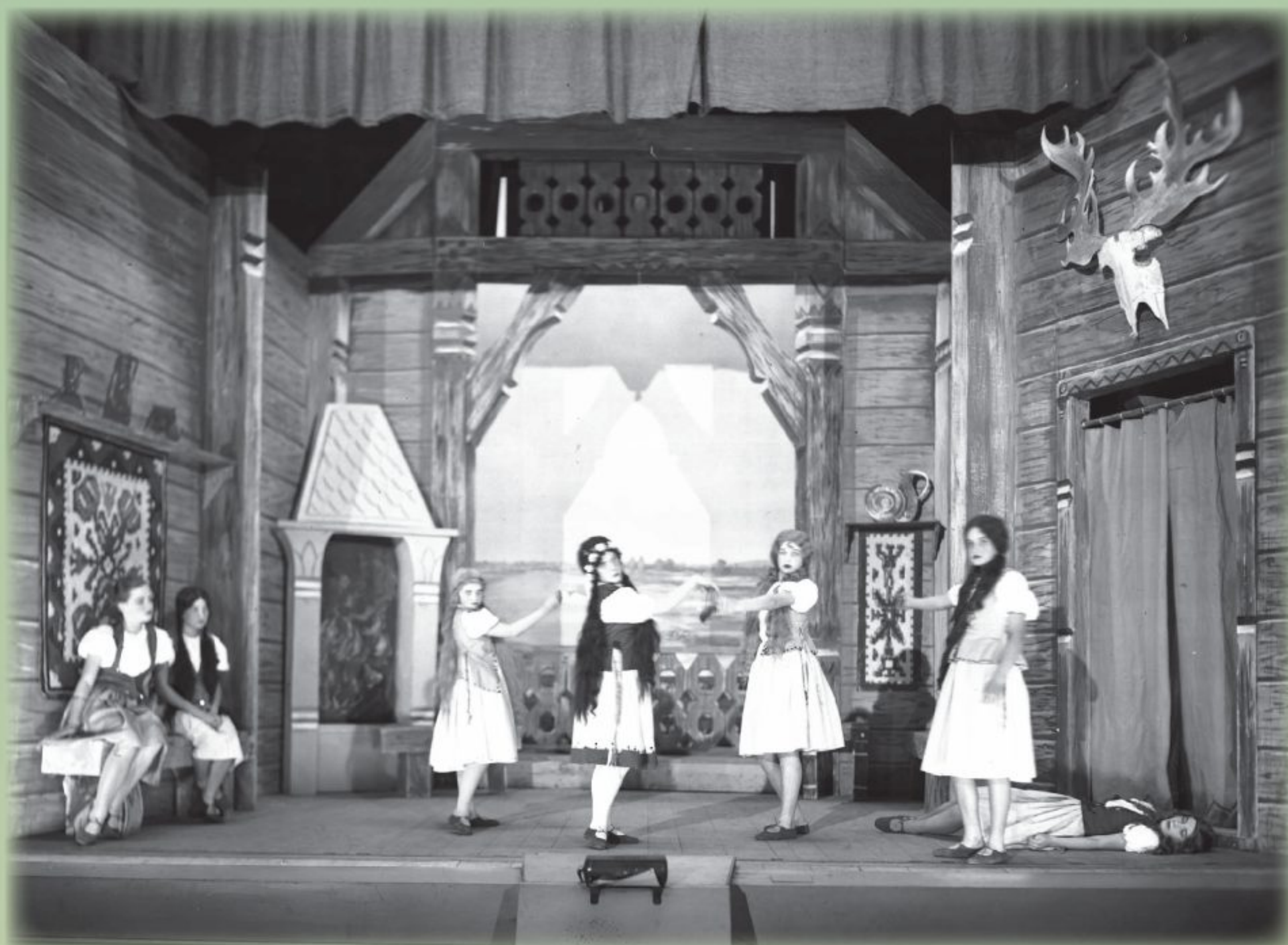
Fragment przedstawienia Stara baśń Józefa Ignacego Kraszewskiego w Teatrze Bagatela w Krakowie, 1930, NAC, 1-K-10154-1