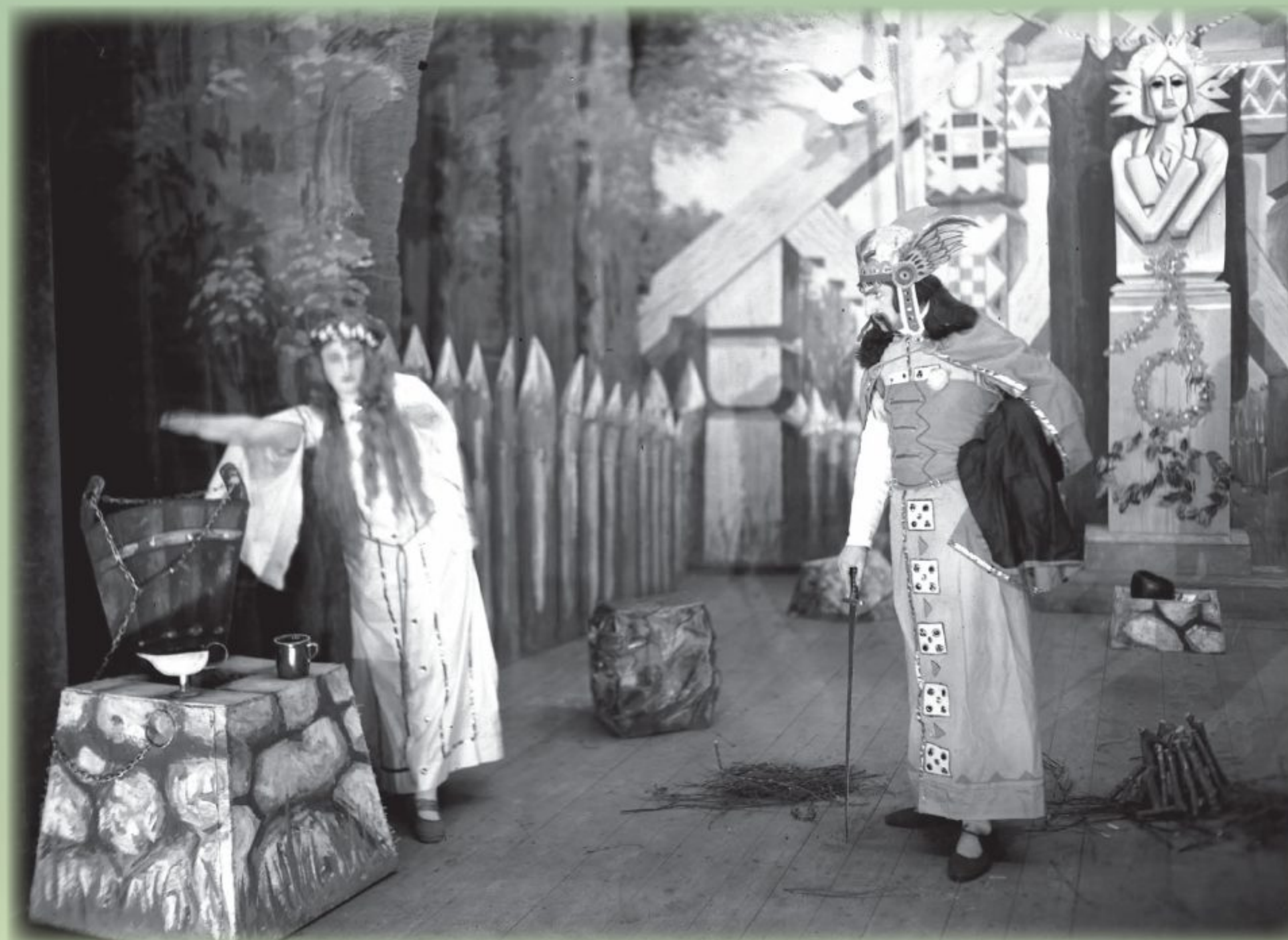
Fragment przedstawienia Stara baśń Józefa Ignacego Kraszewskiego w Teatrze Bagatela w Krakowie, 1930, NAC, 1-K-10154-4