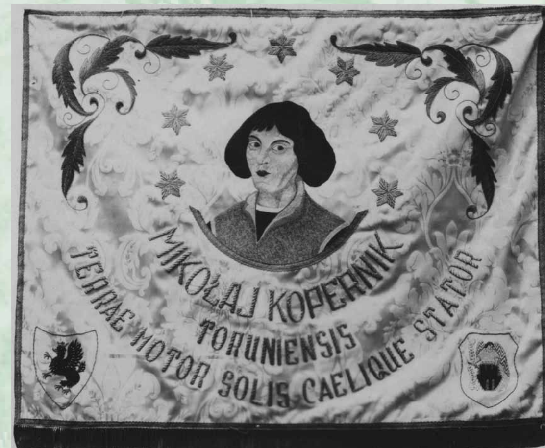
Sztandar Państwowego Gimnazjum Męskiego im. Mikołaja Kopernika w Toruniu (obecnie I Liceum Ogólnokształcące); w 1568 roku ze Szkoły Miejskiej działającej przy bazylice Świętych Janów Chrzcziciela i Ewangelisty w Toruniu, w której pierwsze nauki prawdopodobnie pobierał Mikołaj Kopernik, powstała Schola Thoruniensis; w 1926 roku nadano jej imię Mikołaja Kopernika