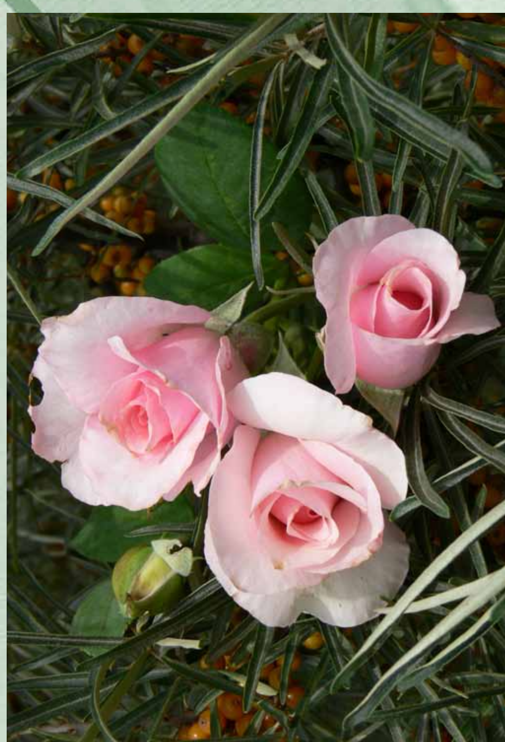
Róża „Mikołaj Kopernik” wyhodowana w 1969 roku przez Bolesława Wituszyńskiego, jasnoróżowa, o średnicy kwiatów 8–10 cm, pachnąca, 2012, PAN Ogród Botaniczny CZRB w Powsinie