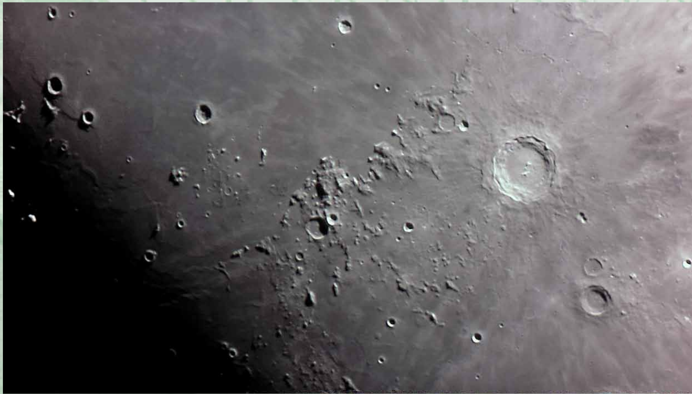
Duży krater na Księżycu, http://xaal66.blogspot.com/2012/03/sesja-20120302-i-20120303-testy-kamerki.html , 13 lipca 2012