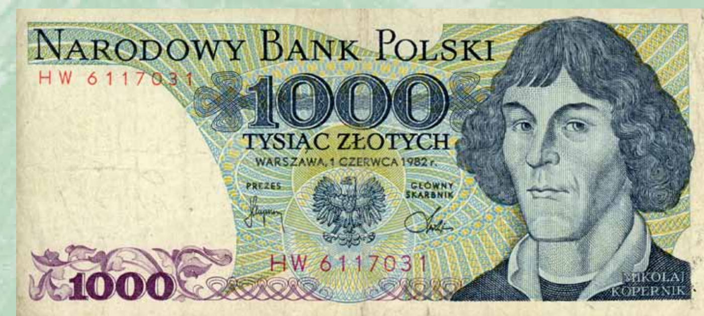
Banknot 1000 zł z wizerunkiem Mikołaja Kopernika według oryginału toruńskiego; czas obiegu 1975–1996; emitowany trzy razy w latach 1975, 1979, 1982; w 1965 roku wyemitowano również banknot o tym samym nominale z tym samym wizerunkiem; czas jego obiegu 1966–1978, 2012