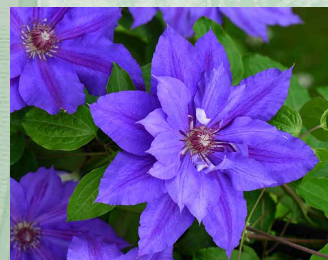
Powojnik „Mikołaj Kopernik”, kwiaty lila, w lecie z odcieniem różowym, średnica około 15 cm; czepia się podpór ogonkami liściowymi; lubi stanowiska słoneczne, 2012, Szkoła Pojemnikowa Clematis, fot. Szczepan Marczyński