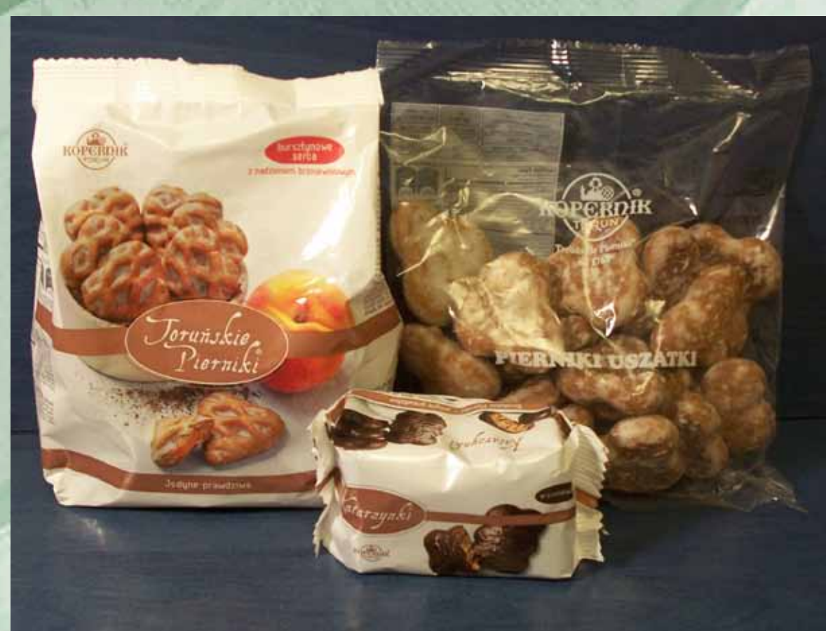
Pierniczki „Kopernik” wytwarzane w Fabryce Cukierniczej „Kopernik” SA w Toruniu, która jest jedną z najstarszych firm w regionie (założona w 1763 roku przez Johanna Weesego) i najstarszą spośród istniejących do dziś; jest największym producentem pierników i wafl w kraju; współczesna technologia wyrobu pierników opiera się na starych recepturach z XVI wieku, 2012