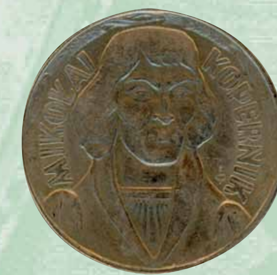
Moneta 10 zł z wizerunkiem Mikołaja Kopernika według oryginału toruńskiego; czas obiegu 1959–1977; emitowana w latach 1959, 1961, 1962, 1965, 2012, fot. Tomasz Rudzki