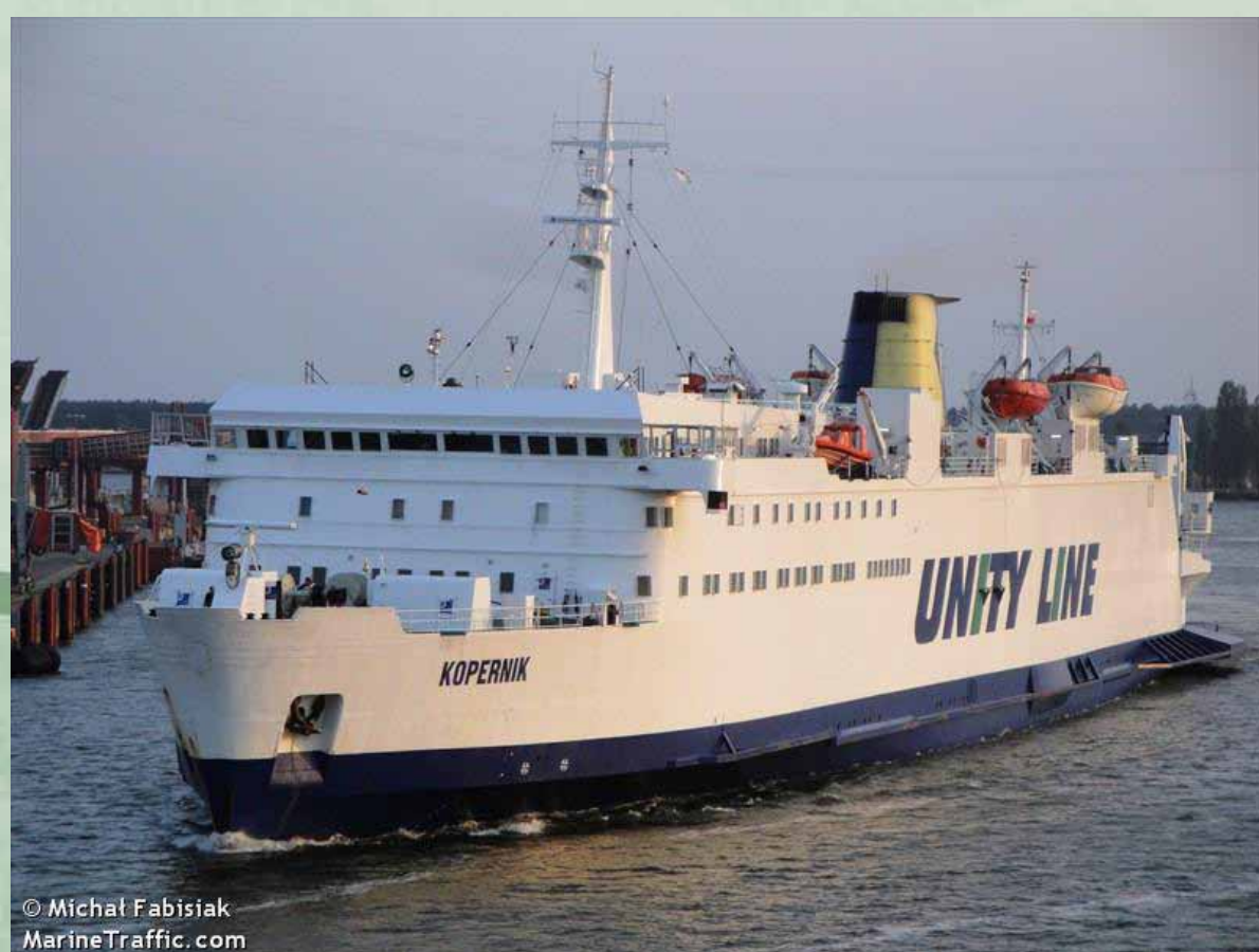
Statek pasażerski MF „Kopernik” zbudowany w 1977 roku w Bergen; w 1993 roku przeszedł gruntowną przebudowę i modernizację; od 2007 roku w służbie polskiego armatora, obsługuje linię Świnoujście–Ystad, 2010, fot. Michał Fabisiak, MarineTraffic.com, http://www.marinetraffic.com/ais/pl/showallthumbs.aspx?copyright=Micha%C5%82%20Fabisiak&var_page=8 , 13 lipca 2012