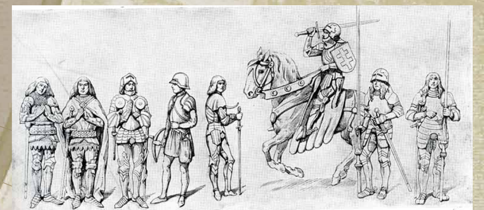
Rycerstwo polskie w okresie 1350–1500, Bronisław Gembarzewski, Polska, jej dzieje i kultura od czasów najdawniejszych do chwili obecnej , Warszawa, około 1927, s. 232