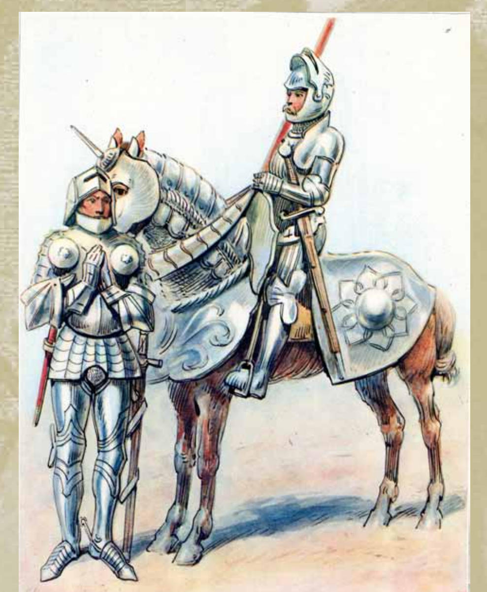
Rycerstwo polskie XV–XVI w., Bronisław Gembarzewski, Polska... , s. 287