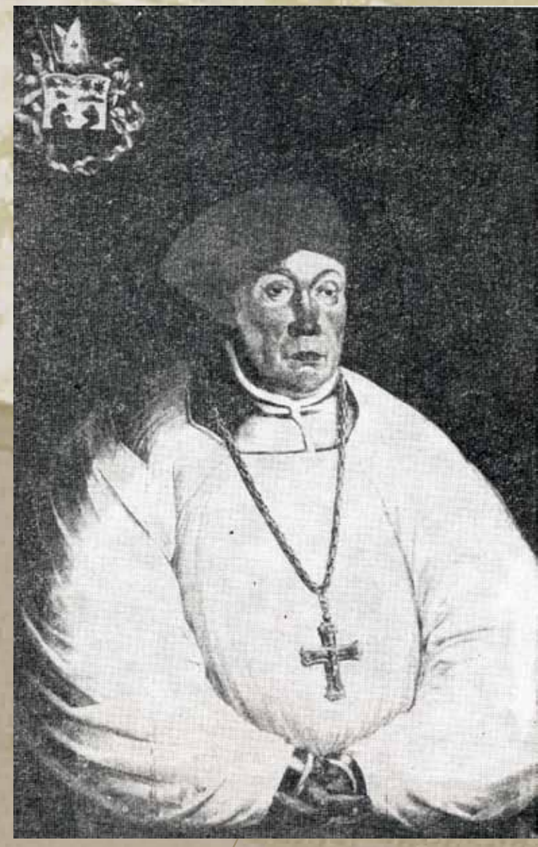
Maurycy Ferber, biskup warmiński, długoletni pacjent Mikołaja Kopernika, Mieczysław Skulimowski, Mikołaj Kopernik, wybitny przedstawiciel medycyny XVI wieku w Polsce 1473–1543 , Kraków 1973, s. 21