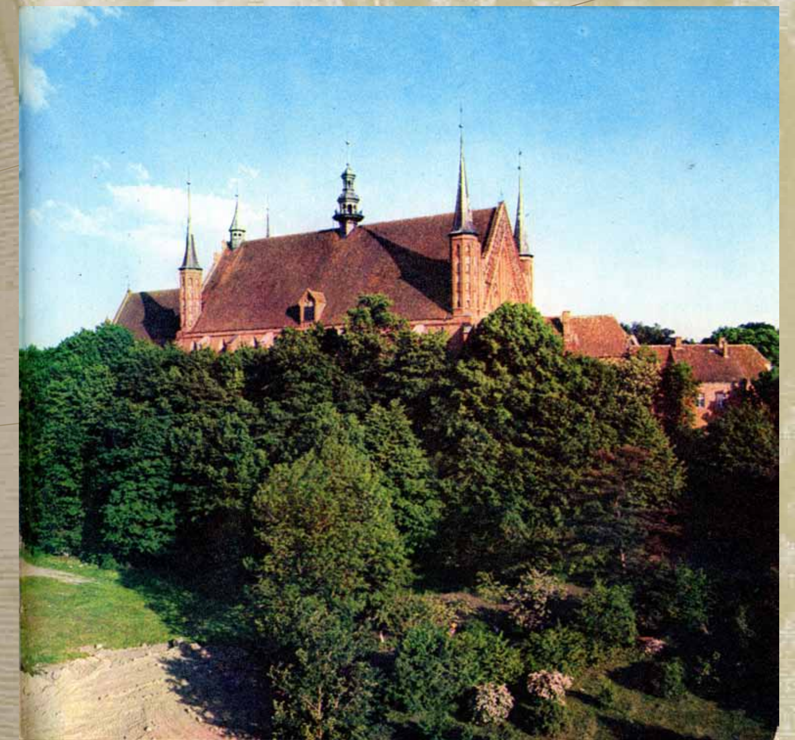
Wzgórze Katedralne we Fromborku

Rządy Mikołaja Kopernika w kapitule warmińskiej przypadły na bardzo trudny okres. Krzyżacy pragnęli przyłączyć Warmię do ziem zakonu. Starali się wszelkimi sposobami zapewnić sobie poparcie Stolicy Apostolskiej, a gdy to się nie powiodło, mistrz zakonu mścił się na mieszkańcach Warmii. Mikołaj Kopernik postanowił przy pomocy prawa, traktatów i umów Rzeczypospolitej z Krzyżakami pokonać wielkiego mistrza. W latach 1519–1521, w czasie wojen krzyżackich, na jego barkach spoczęła obrona warmińskich zamków. Wzmocnił fortyfikacje zamku w Olsztynie, wskutek czego wojska krzyżackie zrezygnowały z jego oblężenia. W roku 1520 Mikołaj Kopernik został przez kapitułę wydelegowany do negocjacji z wielkim mistrzem Albrechtem Hohenzollernem (Kopernika mianowano wówczas komisarzem Warmii). Pisał do króla Zygmunta Starego, że czynić będzie to, „co przystoi ludziom szlachetnym i uczciwym oraz bez reszty oddanym Waszemu Majestatowi – nawet jeśliby przyszło zginąć”. List ten został przechwycony przez Krzyżaków. Dzięki pomocy króla Zygmunta oraz przygotowaniu fortyfikacji i obrony zamku udało mu się zmusić Krzyżaków do zakończenia oblężenia.