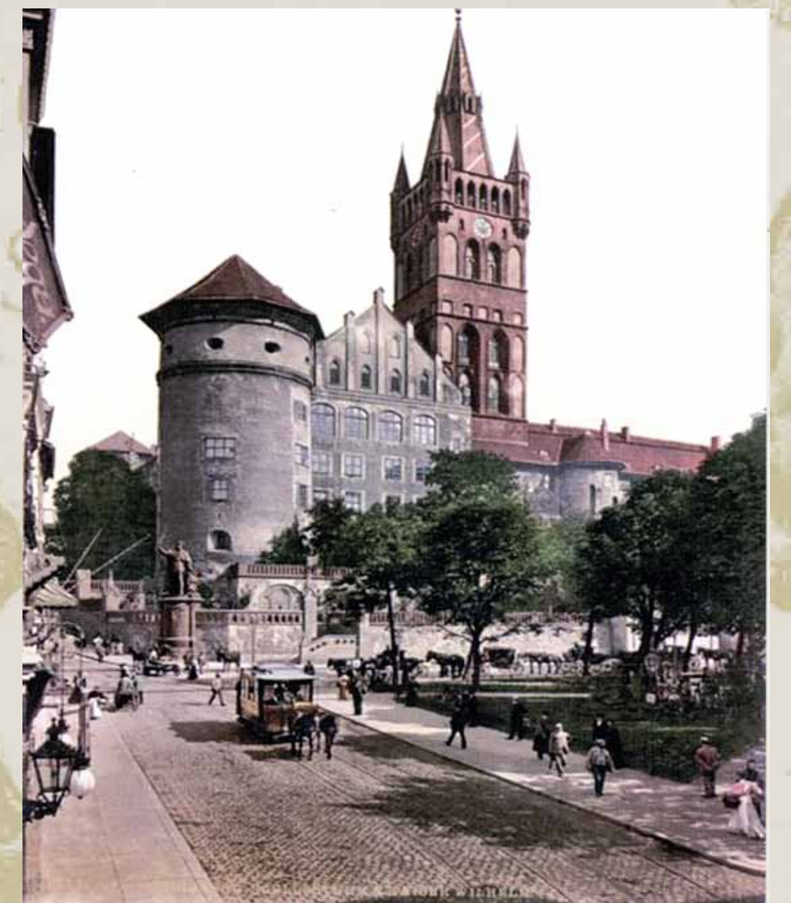
Zamek krzyżacki w Królewcu; Mikołaj Kopernik został tam wezwany przez Albrechta Hohenzollerna; Mikołaj Kopernik był też czołową postacią zachodnich Prus w wojnie z zakonem krzyżackim; zajmował stanowisko biskupiego lekarza i dbał o zdrowie członków kapituły; udzielał medycznych konsultacji i porad najważniejszym osobistościom ze wszystkich części Prus, Niezwykłe biografie. Mikołaj Kopernik 1473–1543. Pasja życia , Warszawa 2009, s. 9