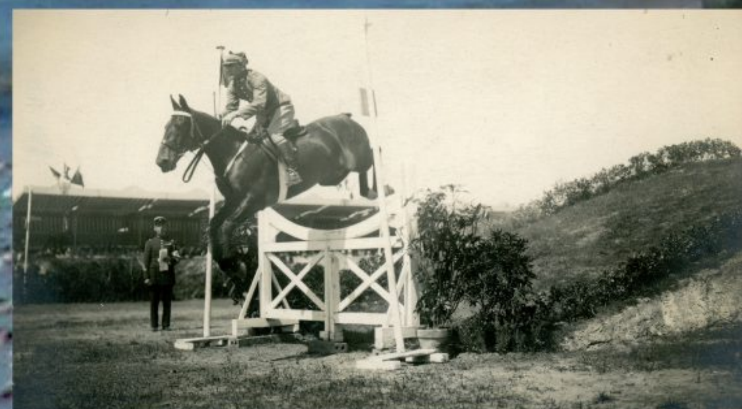
Adam Królikiewicz (1894–1966), major kawalerii Wojska Polskiego, wybitny jeździec, pierwszy Polak, który zdobył medal olimpijski w kategorii indywidualnej – podczas IO w Paryżu (1924) dostał brązowy medal w skokach przez przeszkody na koniu Picador; brał aktywny udział w walkach Legionów Polskich, za co został odznaczony Orderem Virtuti Militari; podczas 2. wojny światowej uczestniczył w kampanii wrześniowej; po wojnie był trenerem i instruktorem jeździectwa; zaproszony przez Andrzeja Wajdę do udziału w scenie z szarżą konną w filmie Popioły, zmarł po tragicznym upadku z konia; dla uczczenia jego pamięci od 1967 roku organizowane są w Krakowie zawody o Memoriał Adama Królikiewicza, b.d.

Daniel Olbrychski o śmiertelnym wypadku Adama Królikiewicza, [w:] Daniel Olbrychski, Anioły wokół głowy , Warszawa 1992, s. 64–65.