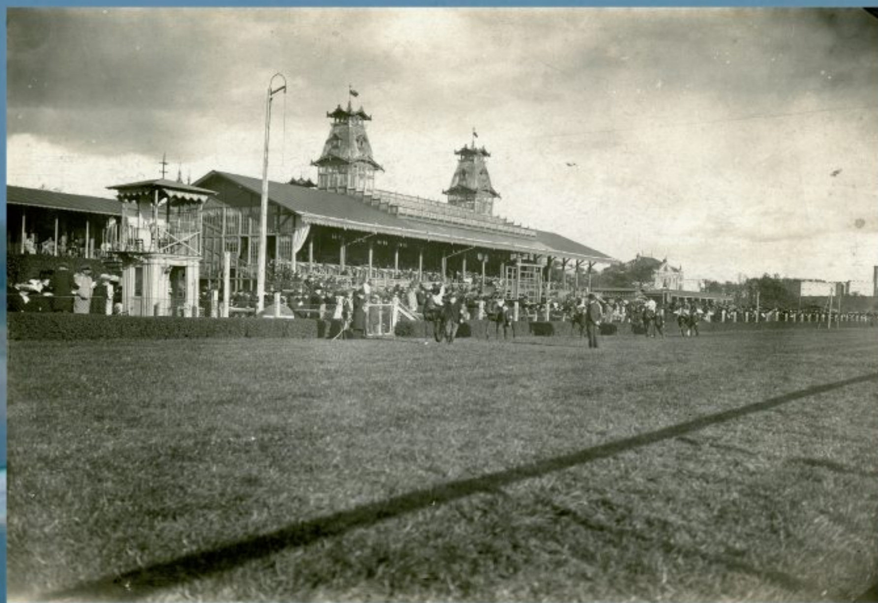
Wyścigi konne na ul. Polnej w Warszawie, koniec XIX w., Materiały Juliana Adama Majewskiego, APAN, III-175, j. 59, b.p.