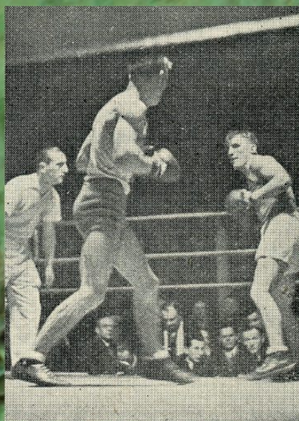
Mecz bokserski między Warszawą a Berlinem rozegrany w Warszawie; w starciu lepsi okazali się polscy pięściarze, 1935, „Kurier Warszawski. Niedzielný Dodatek Ilustrowany”, 30 marca 1935, Materiały Antoniego Czubyńskiego, APAN, III-172, j. 308, k. 131