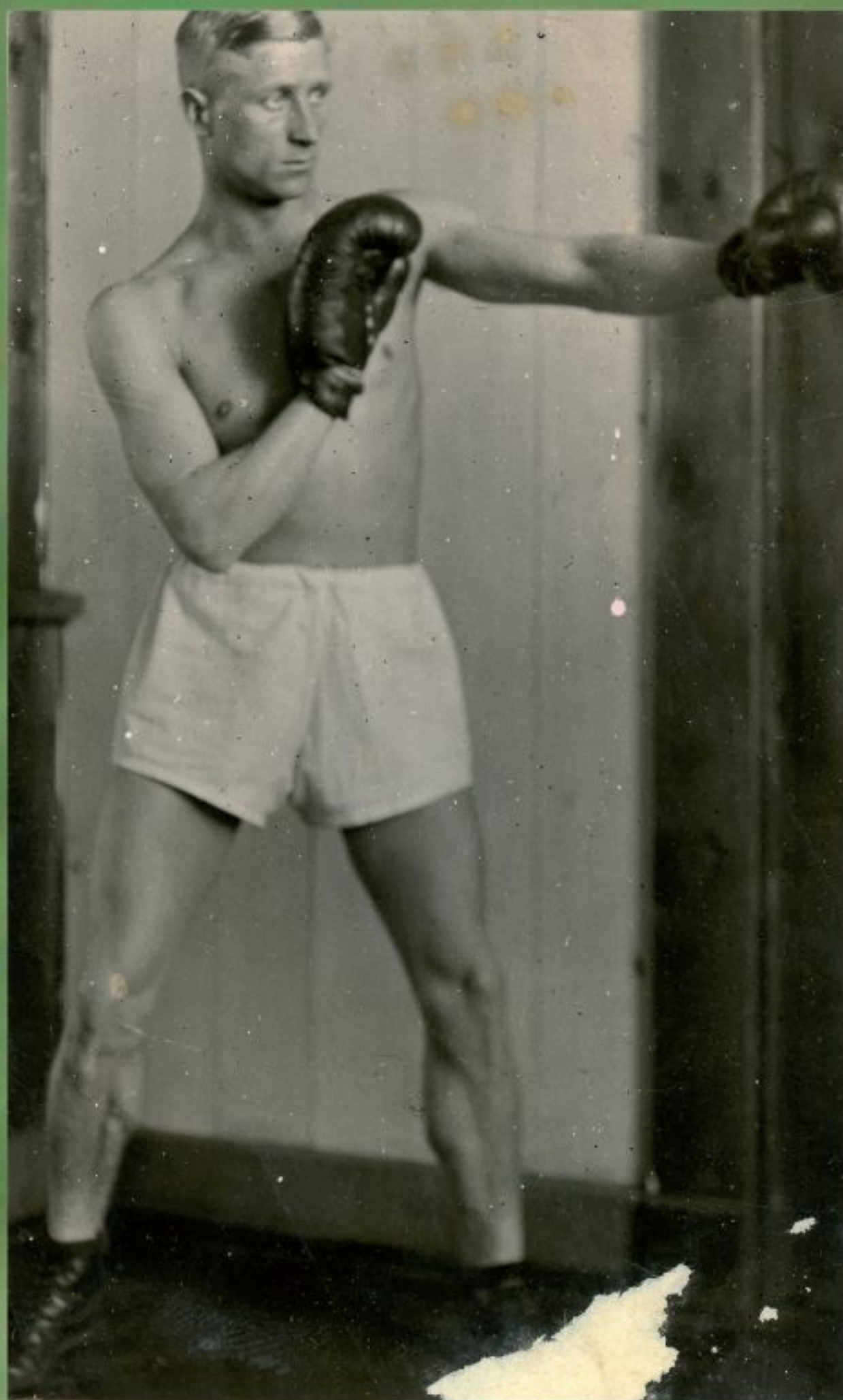
Jan Baran-Bilewski (1895–1981), kapitan Wojska Polskiego, jeden z pionierów polskiego sportu, lekkoatleta, piłkarz, bokser, zdobywca złotego (bieg drużynowy na 3000 m), srebrnego (bieg indywidualny na 3000 m) i brązowego medalu (bieg na 800 m) podczas pierwszych Lekkoatletycznych MP Seniorów we Lwowie (1920), trzykrotny medalista MP w Pięcioboju Nowoczesnym (1926, 1928, 1929), prezes Polskiego Związku Bokserskiego (1925–1927); pracował w Centralnym Instytucie Wychowania Fizycznego, gdzie wykładał m.in. z Feliksem Stammem; w czasie 2. wojny światowej brał udział w kampanii wrześniowej; podczas pobytu w obozie koncentracyjnym Oflag IIC Woldenberg udało mu się zorganizować olimpiadę obozową; po wojnie nadal zajmował się działalnością sportową, zasiadając m.in. w Zarządzie Polskiego Związku Lekkiej Atletyki (1945–1947) oraz redagując pisma sportowe; jest autorem podręczników związanych z lekkoatletyką i pięciobojem nowoczesnym; jego brat Józef, również wybitny lekkoatleta, uczestnik IO w Amsterdamie (1928), został zamordowany w Katyniu, b.d., Materiały Mieczysława Orłowicza, APAN, III-92, j. 230, k. 66