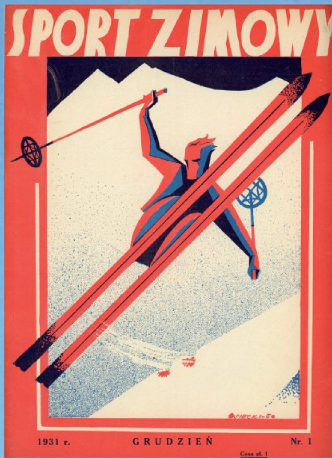
Okładka czasopisma „Sport Zimowy”, jednego z wielu pism o tematyce sportowej okresu międzywojennego, „Sport Zimowy”, grudzień 1931, Materiały Mieczysława Orłowicza, APAN, III-92, j. 611, k. 81