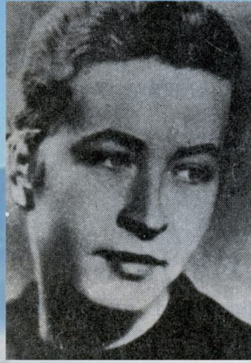
Stanisław Marusz (1913–1993), jeden z najlepszych skoczków narciarskich w historii Polski, dwuboista, alpejczyk (w biegu zjazdowym i kombinacji alpejskiej), czterokrotny reprezentant Polski na igrzyskach olimpijskich (ZIO w Lake Placid 1932, ZIO w Garmisch-Partenkirchen 1936, ZIO w St. Moritz 1948, ZIO w Oslo 1952), wielokrotny mistrz Polski; w czasie 2. wojny światowej nie zgodził się na propozycję Niemców objęcia posady trenera, za co spotykały go represje; był podporucznikiem Armii Krajowej; jego postawa oraz ucieczki z więzienia wywoływały podziw polskiego społeczeństwa; po 1945 roku kontynuował karierę sportową; startował na nartach przez ponad 30 lat; Helena Marusarzówna (1918–1941), mistrzyni sportów narciarskich, siedmiokrotna mistrzyni Polski; jej sportowe sukcesy zostały przerwane przez wybuch 2. wojny światowej, podczas której była kurierem tatrzańskim; zaangażowała się w działalność Związku Walki Zbrojnej, co przyplaciła życiem, b.d., Mała encyklopedia sportu, t. II, s. 128

Uprawiając narciarstwo, nawet w początkach kariery nie zaznałem uczucia lęku przed niebezpieczną skocznią lub trasą. [...] Rzucałem wyzwanie losowi, co mnie wręcz ekscytowało. [...] Sport był dla mnie życiem, życie było sportem. Narty były treścią mego życia, największą pasją. Twierdzono, że mam wyjątkowy talent. Jeśli nawet tak było, to przecież sam talent nie wystarczy, aby zostać mistrzem. Trzeba się uczyć i ustawicznie pracować nad sobą. Nie wolno się zrażać początkowymi niepowodzeniami. Sukcesy nie przychodzą łatwo.