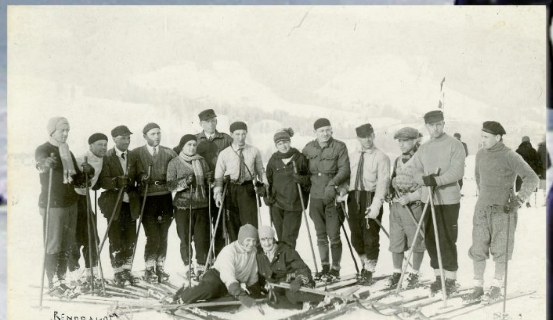
Kurs narciarski w Zakopanem dla absolwentów Państwowego Instytutu Wychowania Fizycznego, 1930