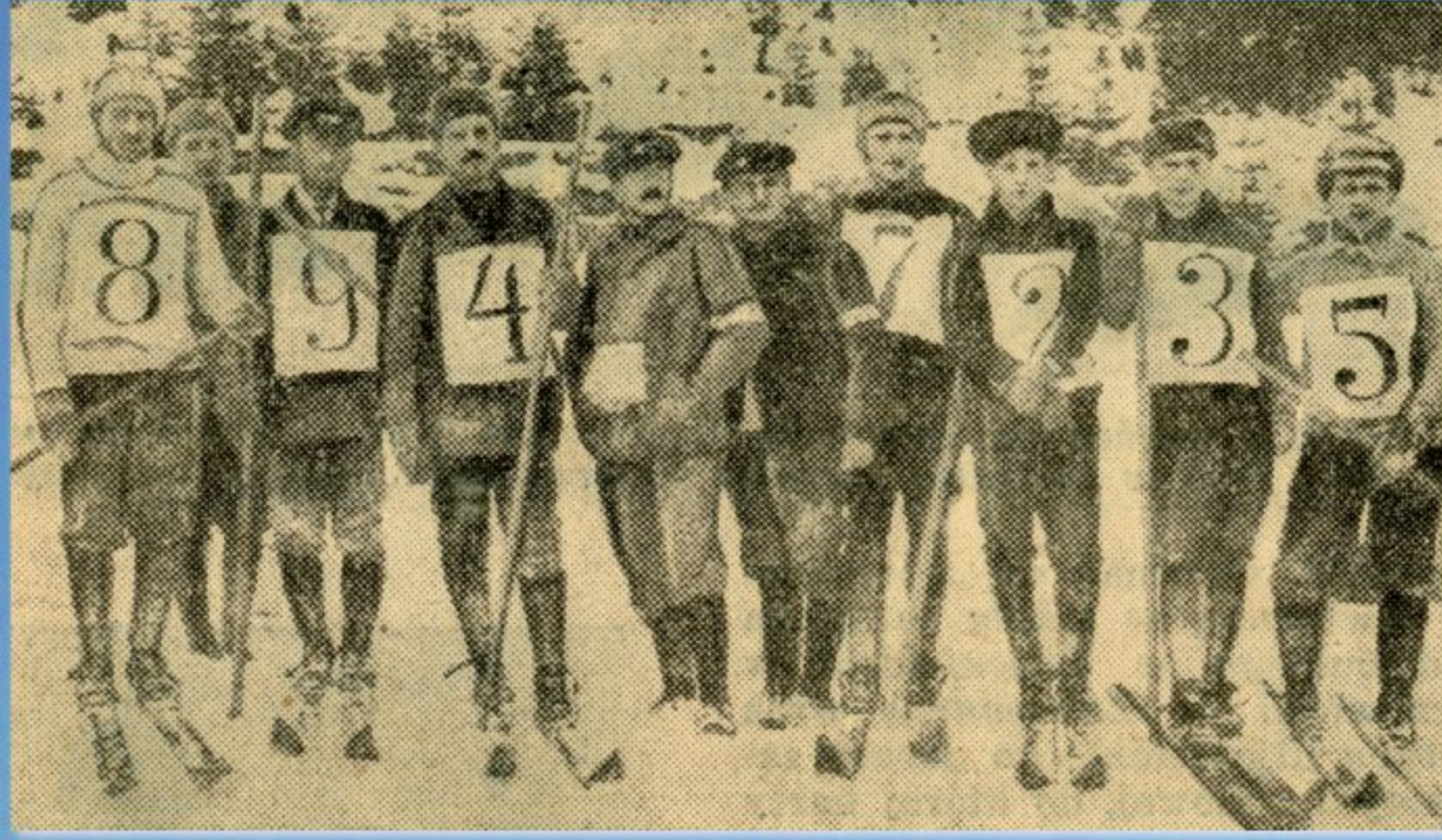
Uczestnicy pierwszych zawodów narciarskich, 1910, „Kurier Literacko-Naukowy”, 9 stycznia 1935, Materiały Mieczysława Orłowicza, APAN, III-92, j. 237, k. 82