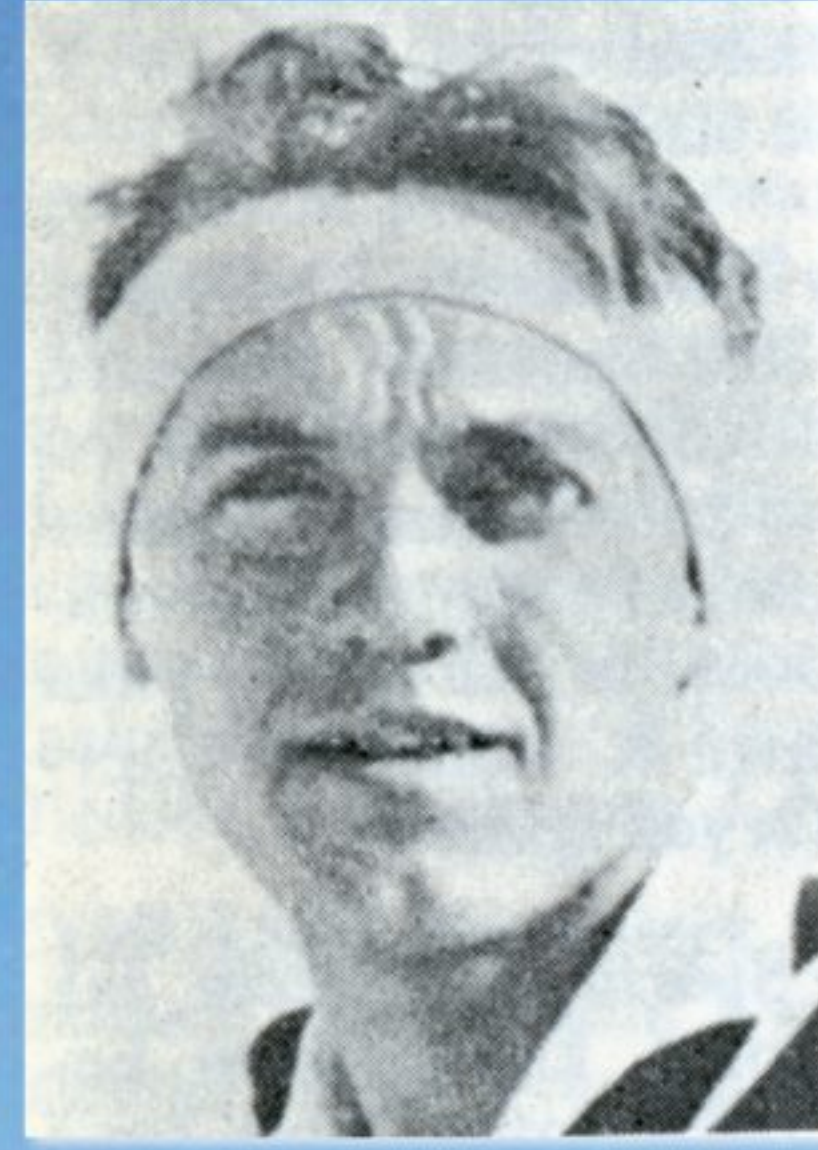
Bronisław Czech (1908–1944), wybitny skoczek narciarski dwudziestolecia międzywojennego, uprawiający też narciarstwo klasyczne i alpejskie, taternik, ratownik górski, pilot, instruktor szybowcowy, lekkoatleta, tenisista stołowy, dwudziestokrotny mistrz Polski w konkursach narciarskich, olimpijczyk (ZIO w St. Moritz 1928, ZIO w Lake Placid 1932, ZIO w Garmisch-Partenkirchen 1936), uczestnik licznych zawodów międzynarodowych, malarz na szkłe, rzeźbiarz, poeta; potrafił zatańczyć na nartach walca; grał na skrzypcach i akordeonie; jego karierę sportową przerwała 2. wojna światowa; zginął w 1944 roku w obozie Auschwitz-Birkenau; dla uczczenia pamięci jego i Heleny Marusarzówny od 1946 roku organizowane są międzynarodowe zawody o Memoriał Bronisława Czecha i Heleny Marusarzówny, b.d., Encyklopedia sportu, t. I, s. 126