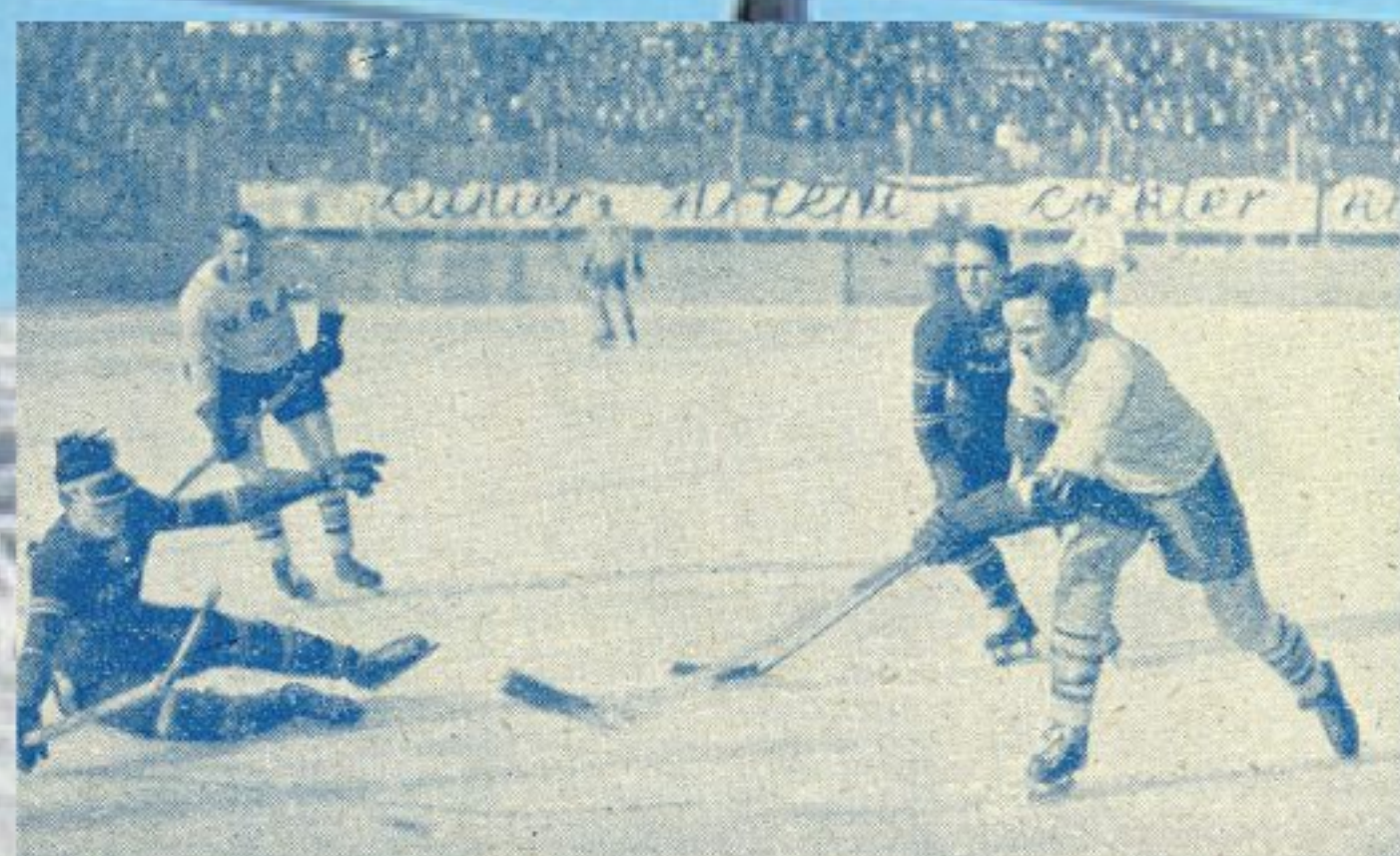
Fragment meczu między Polską a Stanami Zjednoczonymi rozegranego podczas MŚ w Hokeju na Lodzie w Krynicy; mecz zakończył się wynikiem 1:0 dla Amerykanów; Polacy mimo kilku wygranych spotkań, m.in. ze Szwecją i Francją, ostatecznie usytuowali się na czwartym miejscu; tytuł mistrzów świata przypadł Kanadyjczykom, którzy w finale pokonali Stany Zjednoczone, 1931, „Sport Zimowy”, luty 1931, Materiały Mieczysława Orłowicza, APAN, III-92, j. 611, k. 64

Hokej, hokej, hokej – nic innego się tu nie słyszy. Istny szal walk lodowych, jakie stacza na stadionie krynickim 10 narodów świata, rozpala tak pomimo mrozu serca i głowy sportowców, a nawet i niesportowców, że nic innego się nie słyszy, o niczym innym się nie mówi, nie myśli.