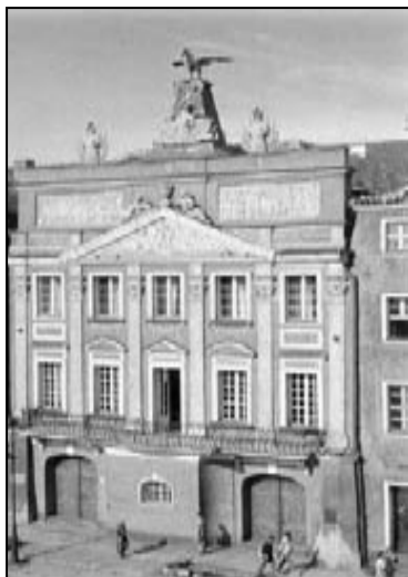
Dawna siedziba Archiwum Polskiej Akademii Nauk Oddział w Poznaniu