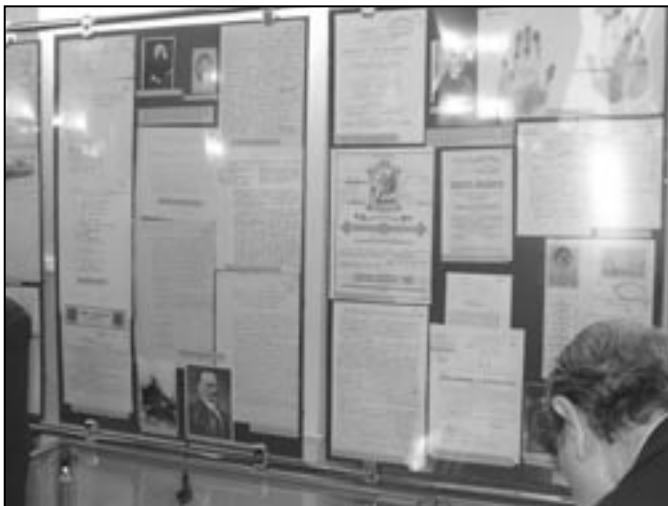
Wystawa Stulecie Towarzystwa Naukowego Warszawskiego , Warszawa, listopad 2007, fot. M. Kaliszczuk-Donaj