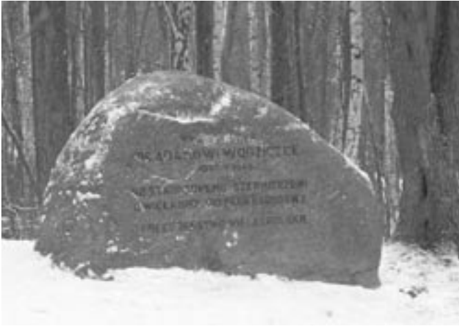
Głaz Wodziczki w Wielkopolskim Parku Narodowym