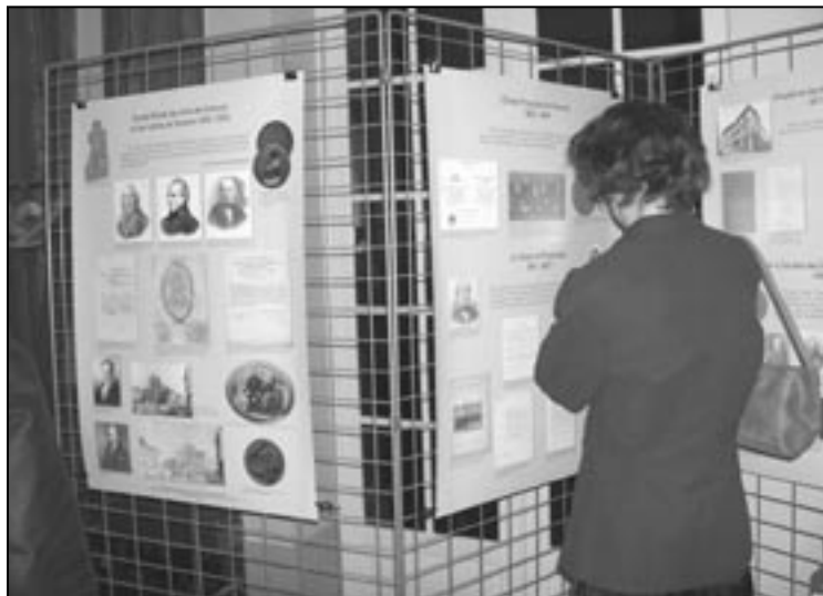
Wystawa Stulecie Towarzystwa Naukowego Warszawskiego , Paryż, kwiecień 2008