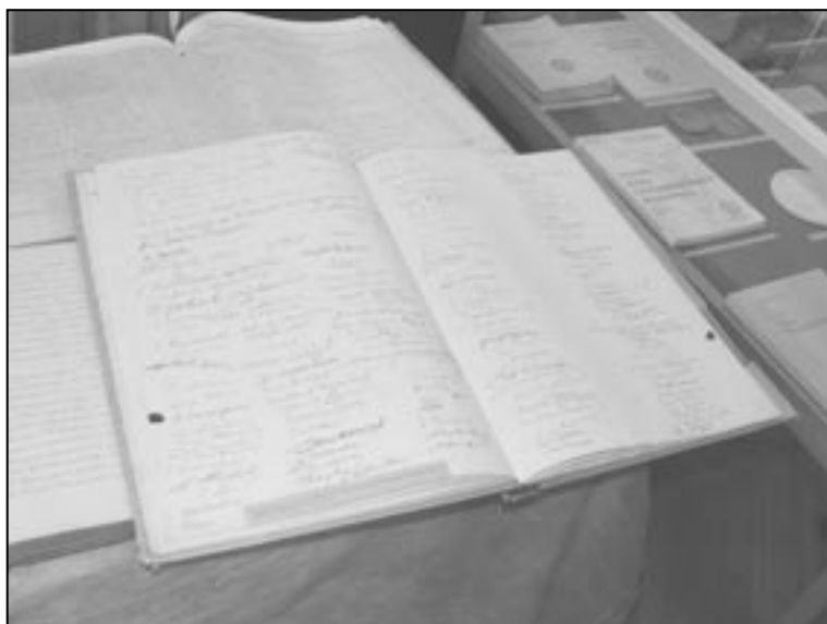
Wystawa Stulecie Towarzystwa Naukowego Warszawskiego , Warszawa, listopad 2007, fot. M. Kaliszczuk-Donaj