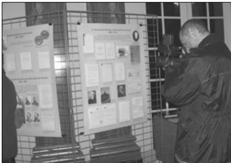
Wystawa Stulecie Towarzystwa Naukowego Warszawskiego , Paryż, kwiecień 2008, fot. J. Arvaniti