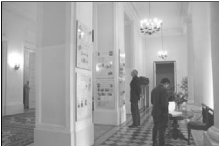
Wystawa Stulecie Towarzystwa Naukowego Warszawskiego , Warszawa, listopad 2007, fot. M. Kaliszczuk-Donaj