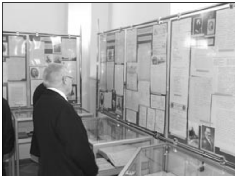
Wystawa Stulecie Towarzystwa Naukowego Warszawskiego , Warszawa, listopad 2007