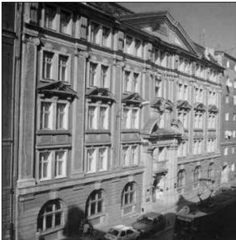
Obecna siedziba Archiwum Polskiej Akademii Nauk Oddział w Poznaniu

Jubileusz 50-lecia poznańskiej filii Archiwum Polskiej Akademii Nauk stał się wspaniałą okazją do podsumowania dorobku naukowego naszej instytucji. Uroczystości rocznicowe były niezwykle wydarzeniem nie tylko dla niewielkiej grupy pracowników Archiwum, lecz także dla całego poznańskiego środowiska archiwalnego.