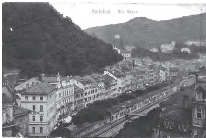
Karlsbad, pocztówka z początku XX wieku, Materiały Mieczysława Orłowicza, APAN, III-92, j. 584

sami ginekolodzy, kąpiele naturalne błotne i urządzenia do tejże kategorii cierpień przystają [a nie na choroby serca]” 2 .