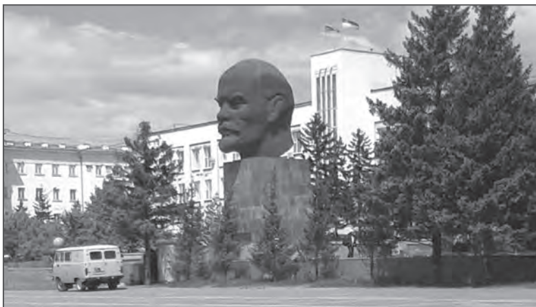
Pomnik W.I. Lenina w Ułan Ude, zwany Głową Lenina, wzniesiony w 1971 r., największy tego typu pomnik na świecie, 2019

Bogactwo materiałów archiwalnych przechowywanych w spuściznach uczonych pozwala na przypuszczenia, że archiwistom i historykom pracy nie zabraknie i ciągle będziemy się cieszyć nowymi odkryciami, rozpoznając nieznane.