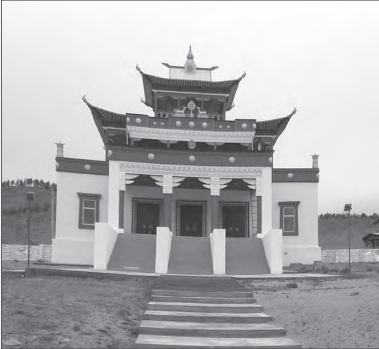
Dacan Acagacki, świątynia buddyjska w pobliżu Ułan Ude, 2019

Sajan Wschodni również po stronie mongolskiej, włącznie z basenem wielkiego jeziora Chubsuguł, przyczyniając się do poznania geograficznego tej części Mongolii. Jaczewski odkrył kilka lodowców w masywie najwyższego szczytu Monch-sardagalbo Buren Chaan (3491 m) na granicy mongolsko-rosyjskiej. Badał również budowę geologiczną i wysokość Sajanów, wyjaśnił charakter i czas pojawienia się działalności wulkanicznej na tym obszarze oraz prowadził obserwacje meteorologiczne, zbierał kolekcje geologiczne i botaniczne, opracował mapę marszrutu ekspedycji z zaznaczoną siecią wodną i punktami astronomicznymi. Sprawozdanie z przeprowadzonych badań zamieścił w „Izwestijach Rosyjskiego Cesarskiego Towarzystwa Geograficznego”, 1888, t. XIX, z. 1. W 1889 roku zajął się badaniami nad wieczną zmarzliną i był w tym zakresie jednym z największych autorytetów w Rosji. „Jaczewski poznał zagadnienie wiecznej zmarzliny już w pierwszych latach swej pracy w Syberii Wschodniej. Wyprawa