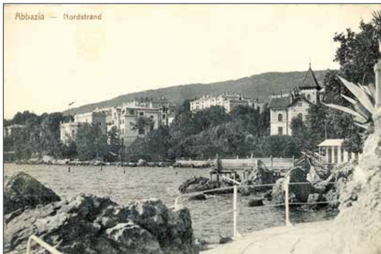
Abacja, początek XX w., Materiały Mieczysława Orłowicza, APAN, III-92, j. 575, k. 30

treść doniosta” 6 . O pobycie Józefa Piłsudskiego w Abacji informuje tablica umieszczona na murze otaczającym willę „Angiolina”.