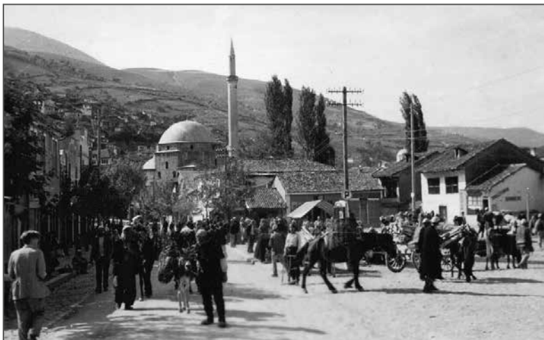
Prizren w czasie 2. wojny światowej, b.d., Materiały Richarda Wojtaszka, KAPAN, W.III-41, j. 1, k. 12

socialistyczną rzeczywistość, między innymi zdjęcie obrazujące ludzi zmierzających do baru mlecznego 3 oraz Stocznnię Gdańską im. Lenina 4 .