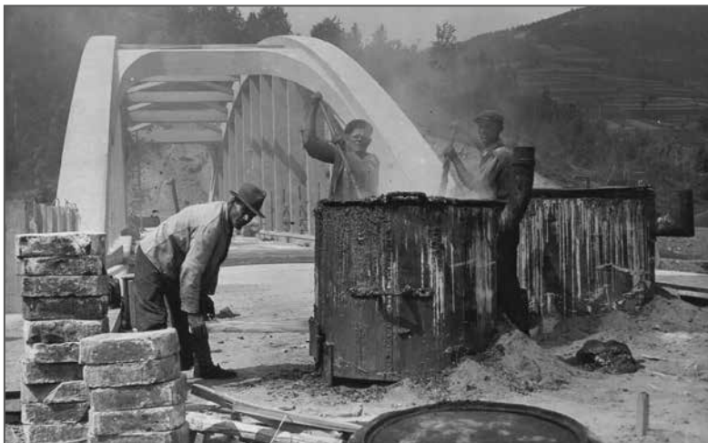
Budowa mostu, b.d., Materiały Włodzimierza Burzyńskiego, KAPAN, W.III-36, j. 95, t. II, k. 256