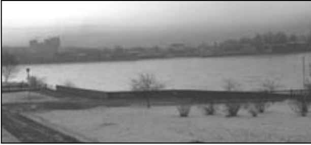
Irkuck nad Angarą, listopad 2008

wanych na wystawie eksponatów. Wkrótce wydane zostaną również materiały pokonferencyjne zawierające bogato ilustrowane teksty referatów wygłoszonych w czasie międzynarodowej konferencji w Irkucku Polacy — badacze Syberii .