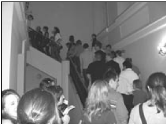
Noc Muzeów, Pałac Staszica, 17/18 maja 2008