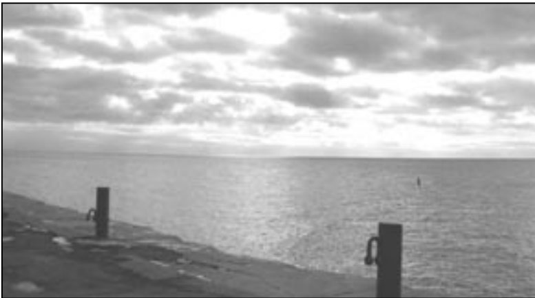
Bajkał, listopad 2008

W związku z dużym zainteresowaniem problematyką syberyjską zamierzamy najbliższy numer „Biuletynu Archiwum Polskiej Akademii Nauk” poświęcić temu tematowi i opublikować przechowywane w naszej instytucji inwentarze archiwalne wybitnych znawców Sybiru — zoologa i lekarza Benedykta Dybowskiego oraz geologa, inżyniera, górnika, poszukiwacza złóż surowców naturalnych na Syberii Karola Nereusza Bogdanowicza, a także glaciologa Leona Barszczewskiego, który utrwalił na fotografiach piękno azjatyckiej ziemi.