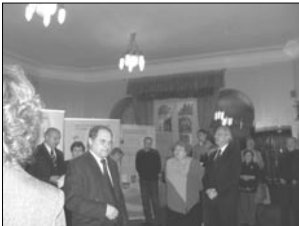
Otwarcie wystawy Polscy badacze Syberii , Irkuck, listopad 2008, fot. J. Arvaniti

gia, paleontologia, publicystyka i socjologia). Scenarzyści mieli nadzieję, że zaprezentowane na wystawie Polscy badacze Syberii unikatowe materiały dostarczą zwiedzającym nie tylko ciekawych informacji, lecz także wielu niezapomnianych wrażeń i szczerych wzruszeń. I rzeczywiście, pokaz dokumentów ilustrujących dokonania naszych rodaków na Syberii wzbudził ogromne zainteresowanie zarówno Polaków, jak i Rosjan, a to głównie za sprawą odmiennego niż dotychczas ujęcia tematu — polscy sybiracy zostali na niej pokazani jako cywilizatorzy pięknej i nieznannej Syberii, nie zaś jako męczennicy zesłani za karę na tę nieludzką ziemię.