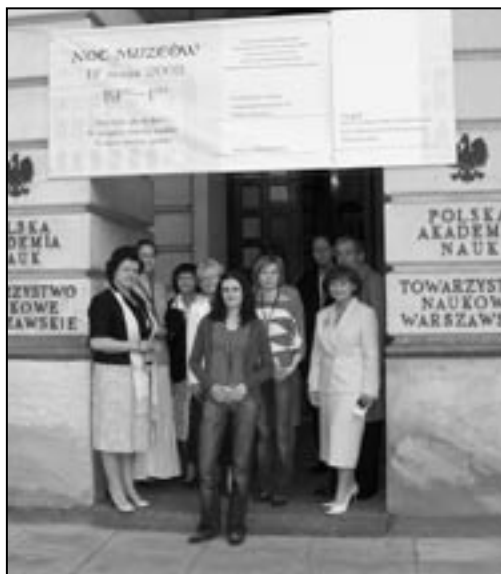
Noc Muzeów, Pałac Staszica, 17/18 maja 2008

W zorganizowaniu i przeprowadzeniu Nocy Muzeów w Pałacu Staszica wzięli udział z ogromnym entuzjazmem wszyscy pracownicy Archiwum Polskiej Akademii Nauk. Poster zaprojektowała i wykonała Maria Kaliszczuk-Donaj