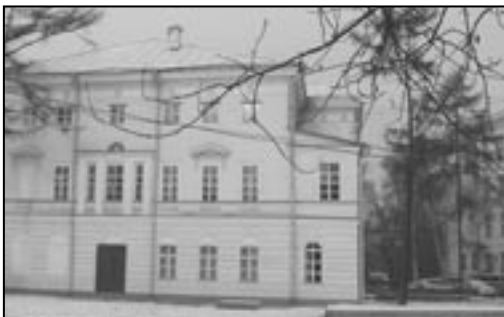
Państwowy Uniwersytet w Irkucku, listopad 2008