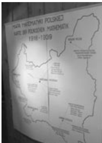
Wystawa Polska szkoła matematyczna 1918–1939, mapa przedstawiająca profil zainteresowań najważniejszych polskich matematyków w dwudziestoleciu 1918–1939, Rapperswil, kwiecień 2008