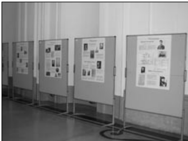
Wystawa Polska szkoła matematyczna 1918–1939 , Wiedeń, październik 2008, fot. A. Grzebieluch