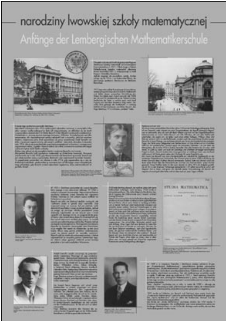
Wystawa Polska szkoła matematyczna 1918–1939 , tablica przedstawiająca narodziny lwowskiej szkoły matematycznej