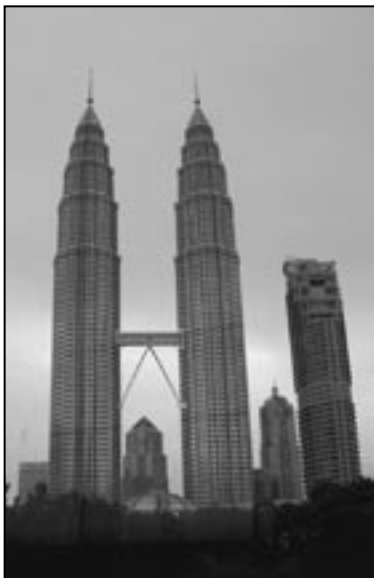
Symbol Kuala Lumpur – wieże Petronas

Strategia ICA, której wizja stworzenia organizacji mającej na celu pomoc archiwistom i archiwom, zgłębianie i rozwiązywanie problemów prawnych, ułatwianie dostępu do informacji i dążenie do transparentności administracji państwowej, realizuje się w misji podnoszenia świadomości, wymiany informacji, edukacji, a także wsparcia w rozwoju demokracji czy nowych osiągnięć technologicznych. Międzynarodowe kontakty archiwalne są szansą dla narodowych poczynań, dlatego powinny być brane pod uwagę w każdym archiwum i każdym stowarzyszeniu.