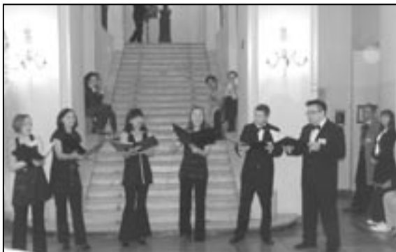
Noc Muzeów, Pałac Staszica, 17/18 maja 2008