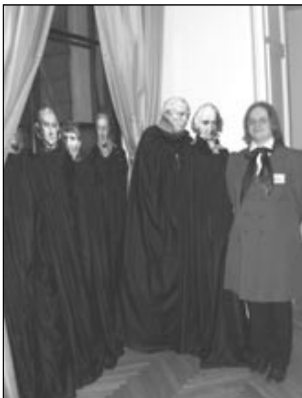
Noc Muzeów, Pałac Staszica, 17/18 maja 2008

Jana Śniadeckiego, matematyka, filozofa i astronoma, do Sądu Głównego Wileńskiego w sprawie sprzedaży na rzecz Uniwersytetu Wileńskiego posiadłości na Serokiszkach w Wilnie i zwolnienia od podatku; list z 1810 roku księcia Adama Jerzego Czartoryskiego, kuratora Wileńskiego Okręgu Naukowego, do władz uczelni w sprawie przyjmowania do publicznych szkół kowieńskich dzieci z Księstwa Warszawskiego. Uwagę zwiedzających zwrócił doskonale zachowany fragment odrębnego planu miasta Wilna z 1672 roku z polskimi nazwami ulic, domów i ogrodów; reprodukcja dagerotypu sprzed