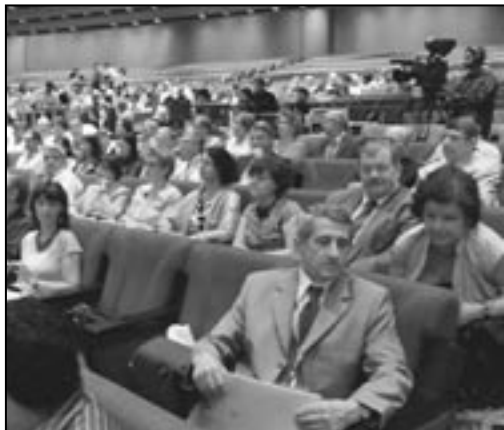
Centrum Kongresowe — ceremonia otwarcia

Z Polski przyjechało na kongres piętnastu archiwistów. Naczelna Dyrekcja Archiwów Państwowych zorganizowała dwie sesje i udział w dys-