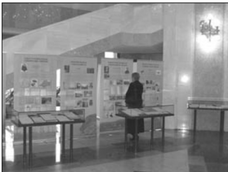
Otwarcie wystawy Polscy badacze Syberii , Moskwa, październik 2008