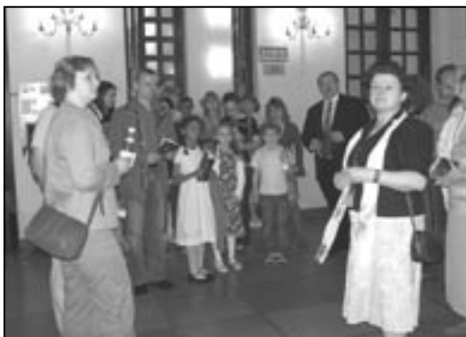
Noc Muzeów, Pałac Staszica, 17/18 maja 2008