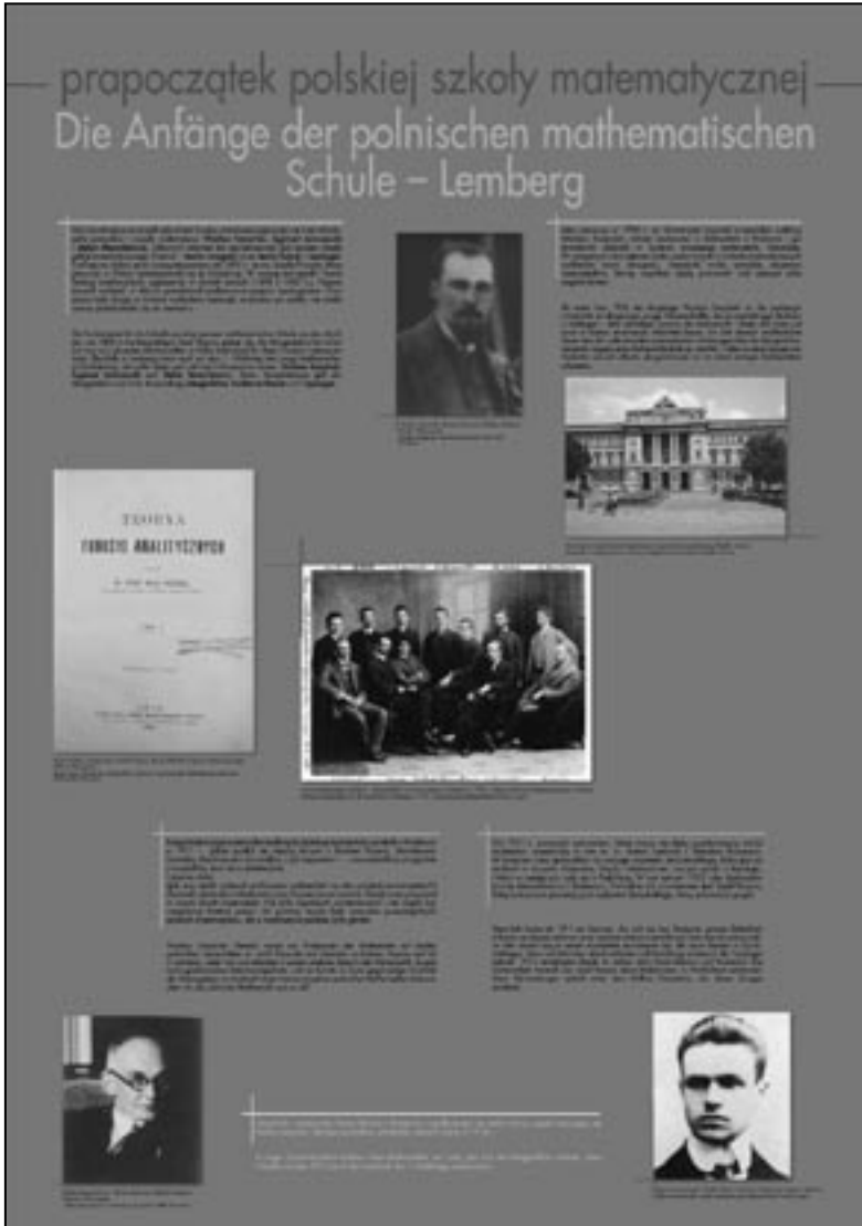
Wystawa Polska szkoła matematyczna 1918–1939 , tablica przedstawiająca prapoczątek polskiej szkoły matematycznej w Lwowie przed wybuchem I wojny światowej