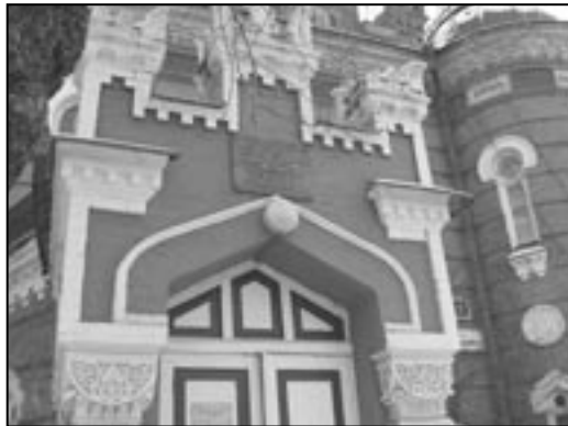
Obwodowe Muzeum Krajoznawcze w Irkucku, listopad 2008