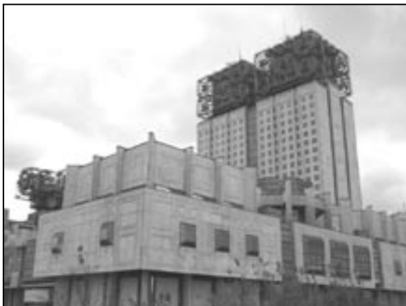
Золотые мозги, czyli Rosyjska Akademia Nauk, fot. T. Rudzki